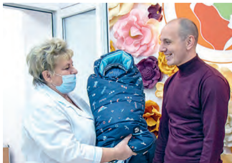
Невидимый боец перинатального фронта