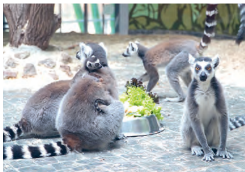
В зоопарке появились новые обитатели