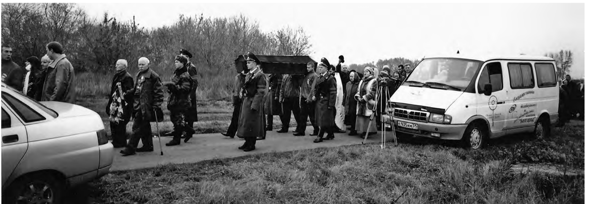
Перезахоронение останков в селе Заячье, 2006 год.