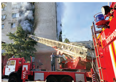
13 стр. Истинно мужская профессия

СКАНИРУЙТЕ QR-код И СМОТРИТЕ ВИДЕО на You Tube канале и « ВКонтакте » #БЕЛГОРОДМЕДИА