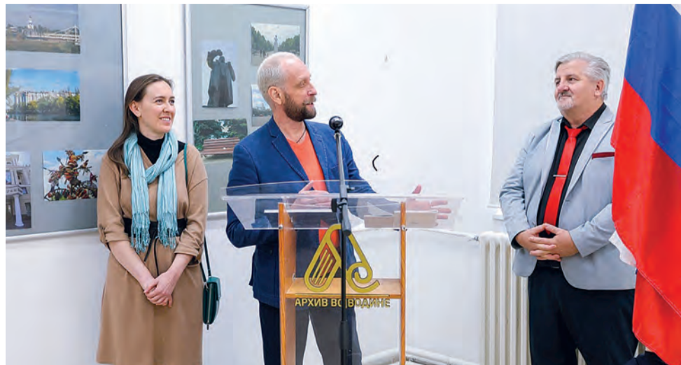
ФОТО УЧАСТНИКОВ МЕРОПРИЯТИЯ