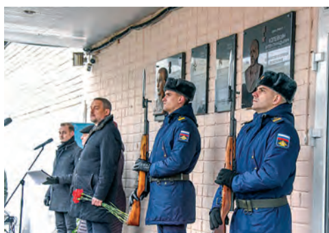
7 стр. Вечная слава героям