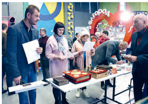
Что собирают белгородцы