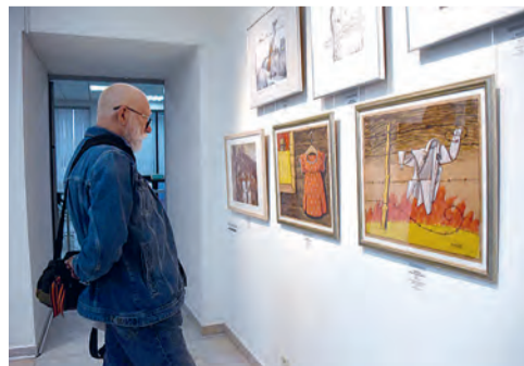
От прошлого к настоящему