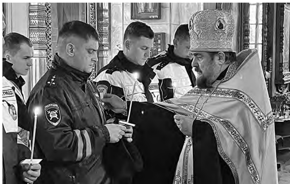
ФОТО ПРЕСС-СЛУЖБЫ УМВД ПО БЕЛГОРОДСКОЙ ОБЛАСТИ

В Белгороде, Борисовке и Грайвороне активисты ЮИДовского движения и волонтеры дорожной безопасности муниципальных молодежных объединений вместе с автоинспекторами вышли в профилактические рейды. Расположившись вдоль оживлённых участков дорог, они призвали автомобилистов к неукоснительному соблюдению ПДД. Юные помощники полицейских также рассказали водителям об истории Всемирного дня памяти жертв ДТП, призвали взрослых ценить собственную жизнь и жизни окружающих. Участники акции вручили автомобилистам и пешеходам памятки, призвав служить примером для юных участников дорожного движения.