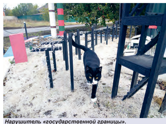
Нарушитель «государственной границы».