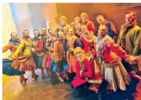
ФОТО АВТОРА И УЧАСТНИКОВ ПОСТАНОВКИ