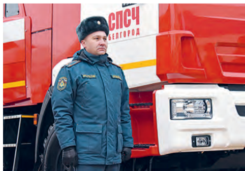
Пожарным - новые машины