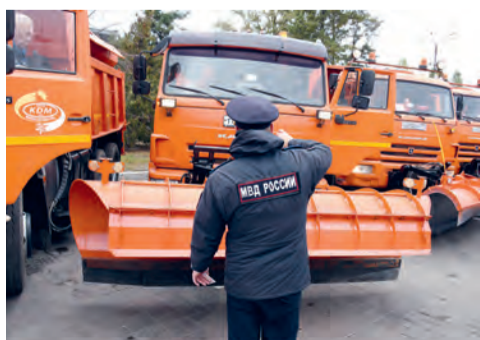
Техника к зиме готова