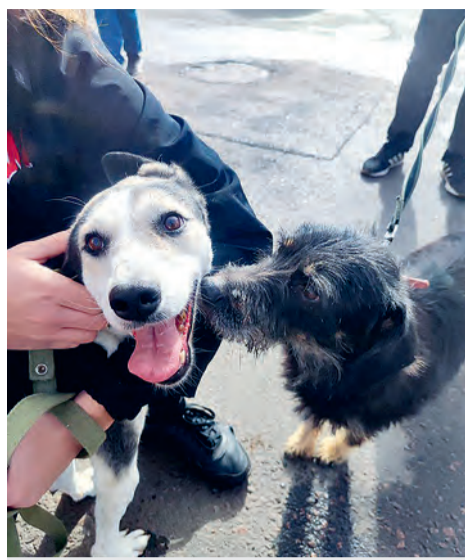
Веснушка и Ньюша.

Новые хозяева не находятся по разным причинам. У кого-то из подопечных сложный характер - к ним нужен определённый подход, другие очень крупные или имеют признаки бойцовской породы - люди боятся с ними не справиться. А есть беглецы, такие как Акела. Его уже никому не отдают, потому что он ото всех сбегает и возвращается обратно в приют. Уже пять раз его пристраивали, и каждый раз он возвращается к своему, наверное, настоящему дому. Есть и тяжело идущие