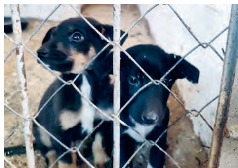
В ожидании дома и друга