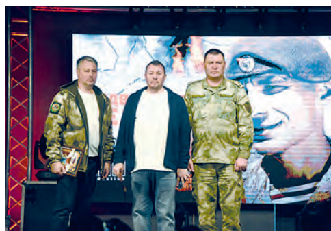
Фильм в память о герое