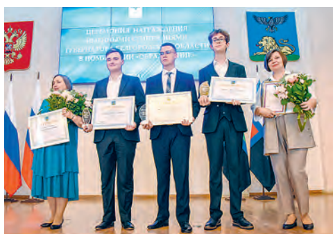
Гордость школы и региона