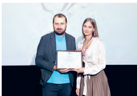
Молодые журналисты получили награды