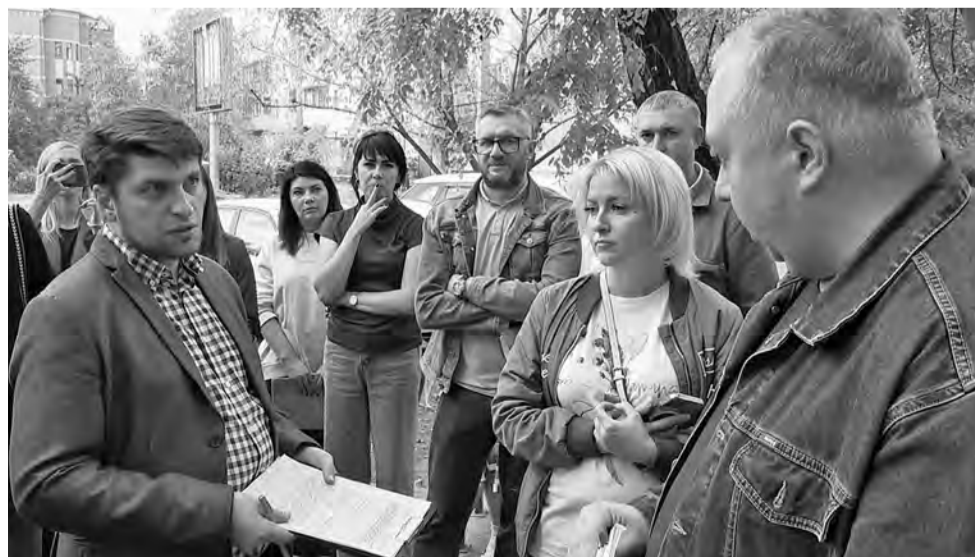
Материалы полосы подготовили Анастасия ИЛЬИНА и Дарья ГАВРОНСКАЯ