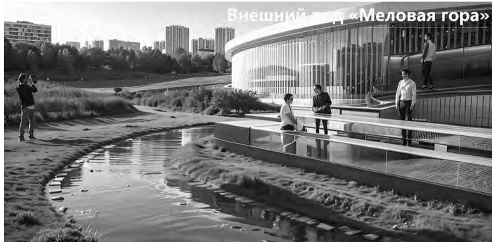
Внешний вид «Меловая гора»