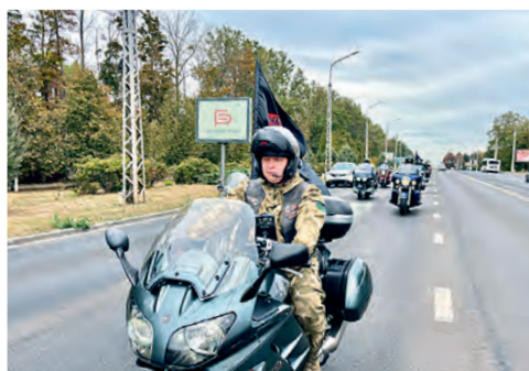
Моточиклисты достойно закрыли сезон