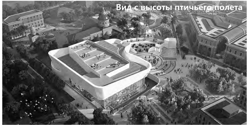
Вид с высоты птичьего полета

- Если говорить об объектах коммерческой части, то в утверждённых фасадах мы постарались сохранить и передать архитектурный код дореволюционного Белгорода. И при проектировании фасадов объектов использовались те элементы, которые были утрачены в зданиях во время Второй мировой войны, - расска-