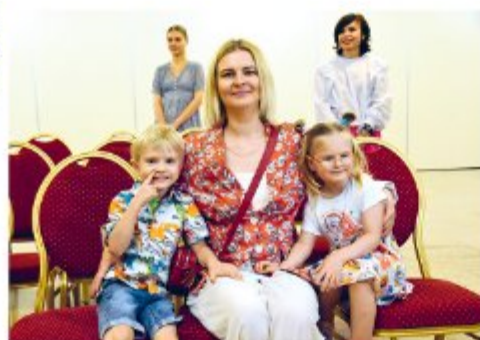
Близнецы - вдвое больше счастья