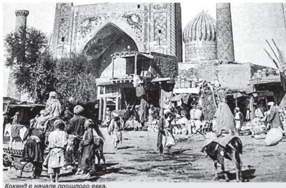
Коканд в начале прошлого века.