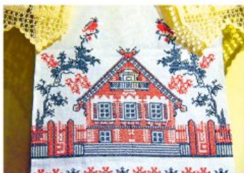
Рushник: история в вышивке