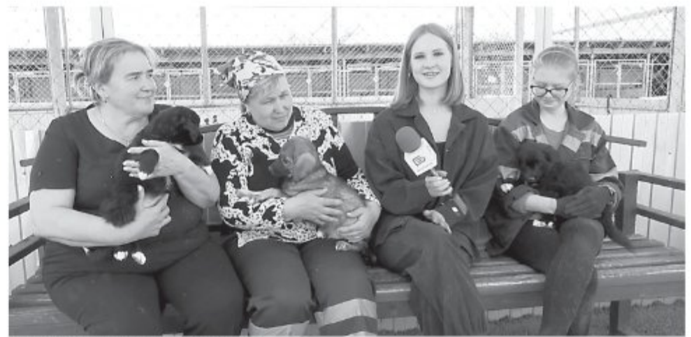
Малыши с работниками приюта.

Кто-то положил новорождённых малышей в коробку и оставил возле магазина в Сосновке. С тех пор «хвостики» ждут своих людей в приюте. У них пока даже нет имён.