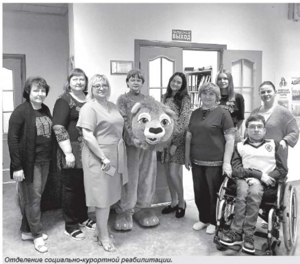
Отделение социально-курортной реабилитации.