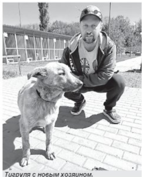
Тигруля с новым хозяином.

Помните Тигрулю, или Какао, о которой мы писали в № 16? Она стала домашней. Месяц назад мы рассказали о собаке в рамках проекта «Я чей-то», а через две