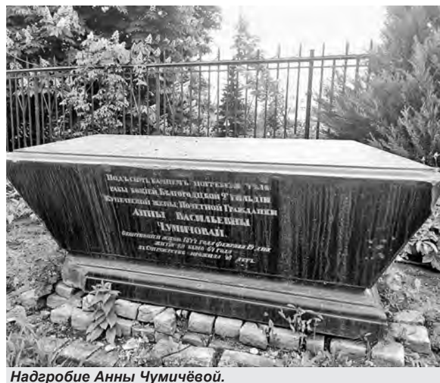
Надгробие Анны Чумичёвой.

Согласно отчёту банка за 1881 год общий оборот операций, проведённых за год, превышал 19 000 000 рублей. Основной капитал банка составлял 200 000 рублей, а резервный (запасной) - более 14 000 рублей. Банк принимал на хранение бессрочные вклады (их общая сумма превышала к 1 января 1882 года 500 000 рублей), срочные вклады сроком от 1 года до 12 лет под 5 - 5,5 % годовых (почти 1 000 000 рублей к 1 января 1881 г.) и вечные вклады (таковых было более 85 000 рублей). Банк проводил операции и с векселями. В 1881 году общая сумма этих операций превысила 2 700 000 рублей. Он также выдавал ссуды под залог: