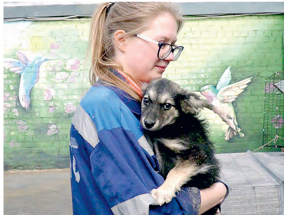
Малышка без имени, но с благородными манерами.