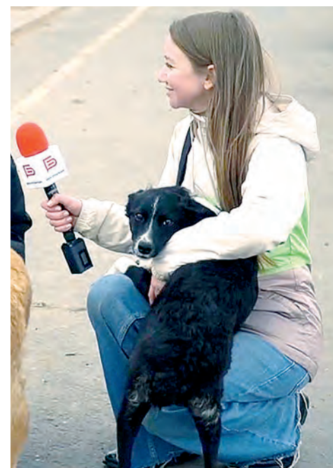
Дейзи во время съёмок фильма.

А на этой неделе мы ищем дом для трогательной и обаятельной дворняжки, которой недавно исполнилось 4 месяца. У неё даже имени ещё нет, сотрудники приюта надеются, что его выберут будущие хозяева. Юная красавица дворняжской породы ведёт себя как настоящая леди, благородная, аккуратная, с пронзительным взглядом. В приют попала в полтора месяца с двумя своими сестричками. Их забрали, а наша леди осталась одна. Она терпеливо ждёт своего чело-