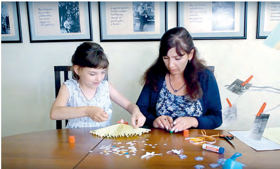
ФОТО ИЗ СОЦИАЛЬНЫХ СЕТЕЙ УЧРЕЖДЕНИЙ КУЛЬТУРЫ