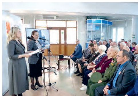
Строители БАМа 50 лет спустя