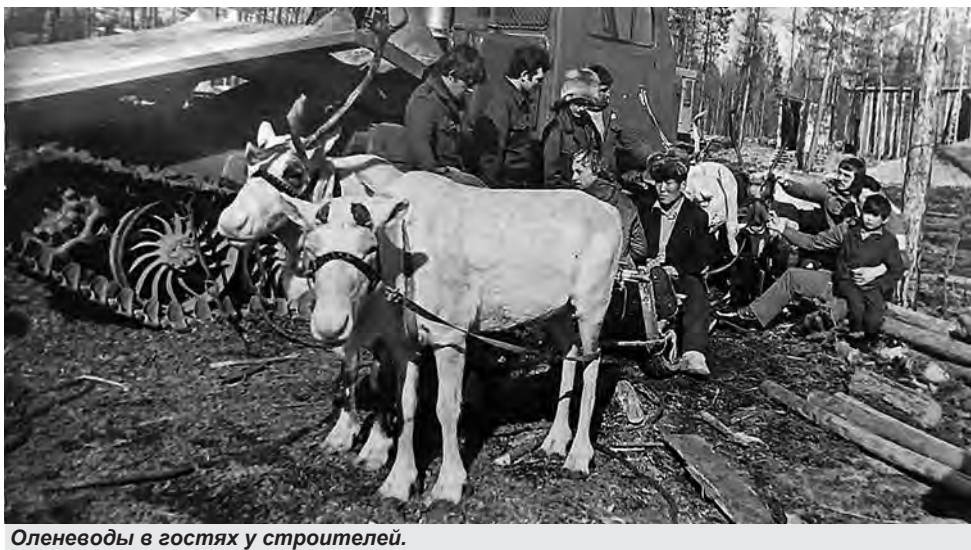
Оленеводы в гостях у строителей.