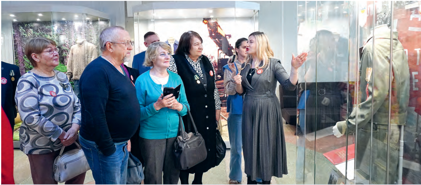
Экспонаты рождают воспоминания.