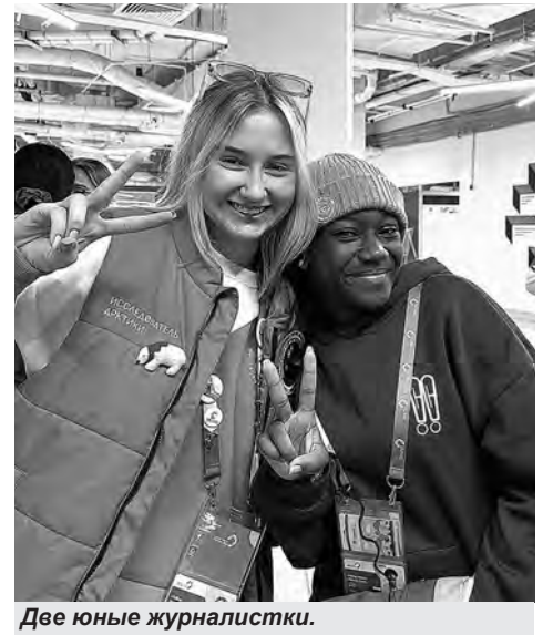
Две юные журналистки.

- Я впервые побывала в России. Это большая страна, где живут самые разные люди. Я понимаю, что могу рассказать только о Москве и Сочи, но в целом мне Россия кажется очень богатой страной в культурном смысле, - говорит она. - Мне