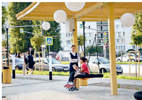
Уютный сквер - другим пример