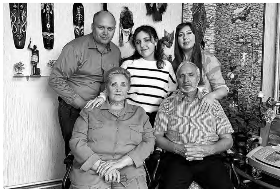
Два поколения энергетиков и будущая журналистка.

В 1967 году они переехали в посёлок Раздолинск Мотыгинского района Красноярского края, он расположен на реке Рыбная, которая впадает в Ангару. Мои родные прокладывали просеки для линий электропередачи. Прадедуськи пилили огромные деревья, а прабабушка с другими женщинами рубили с них ветки. Зимой в сибирской тайге очень много снега, а летом другая беда - это комары и мошка. Рабочим выдавали специальные шляпы с мелкой сеткой. Бабушка рассказывала, что когда у родителей был выходной, дети в этих шляпах ходили в лес по ягоды. А ещё родители приносили с работы оставшийся хлеб и чай с таёжными травами - «гости-