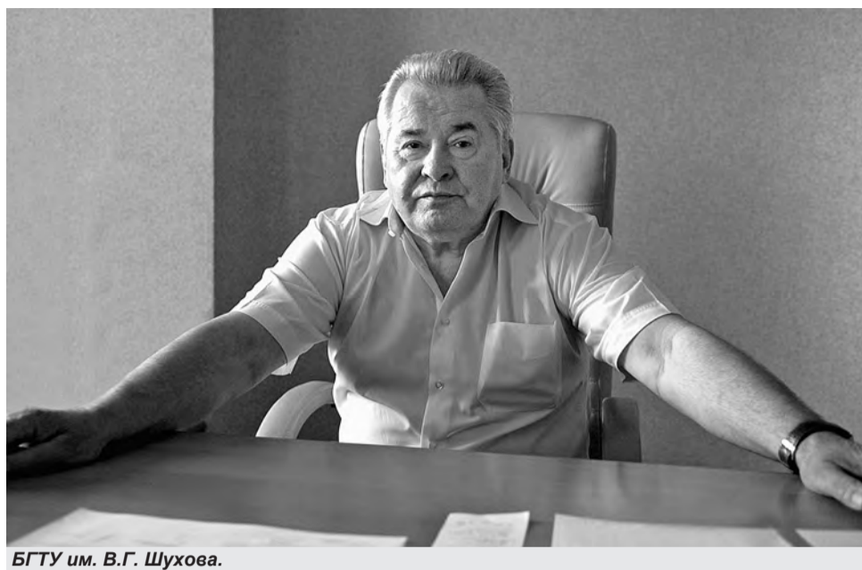
БГТУ им. В.Г. Шухова.