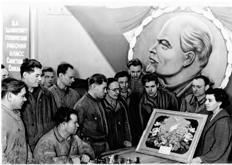
Работники Белгородского цемзавода рассматривают подарок - вышитую картину - от воспитанников подшефного Ютановского детдома, 1962 г.

► С момента образования Белгородской области 6 января 1954 года новому руководству пришлось решать ряд важных насущных проблем. Среди них был и вопрос улучшения условий пребывания в детских домах детей, оставшихся без попечения родителей.