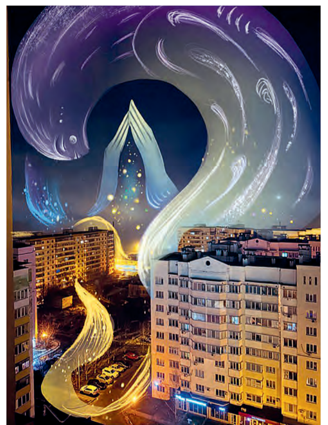
Диана Дударева. «Спи спокойно, любимый район».