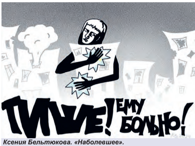
Ксения Бельтюкова. «Наболевшее».

ощущаю... Город, в чём твоя боль? Ты держишься молодцом, но я вижу, чувствую... Обниму тебя, соберу крошки, впитаю каждую каплю и утешу», - пишет автор.