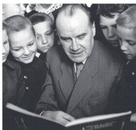
Николай Носов и юные читатели.

Конечно, произведение Николая Носова, заявленное как детская сказка, заканчивается хорошо: с Земли прилетает подмога, лунные бедняки получают семена гигантских растений, которые ни-