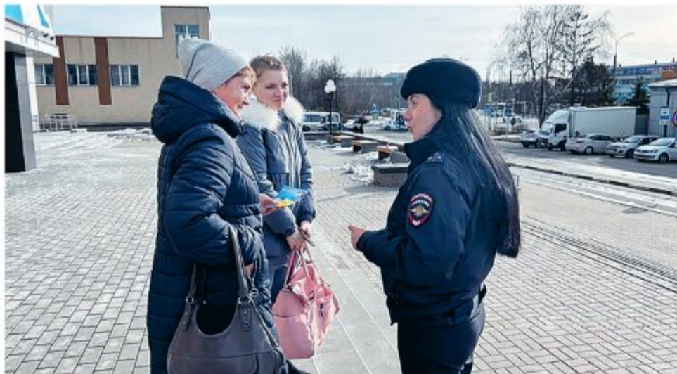
Материалы полосы подготовила Анна БАРАБАНОВА