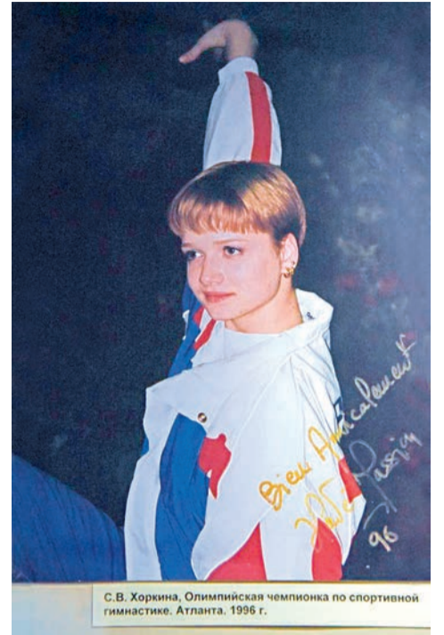
С.В. Хоркина, Олимпийская чемпионка по спортивной гимнастике. Атланта, 1996 г.

Развитие культуры и образования в регионе связано с именами главы попечительского совета музея-заповедника «Прохоровское поле» Николая Рыжкова , начальника областного управления