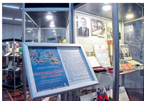
Почётные граждане и история региона