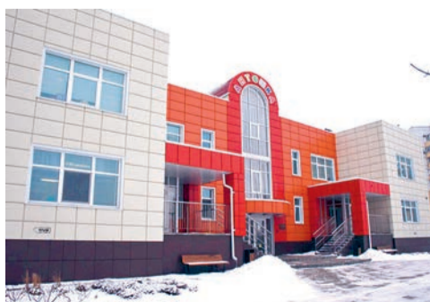
Детский сад № 19 - лучший в области