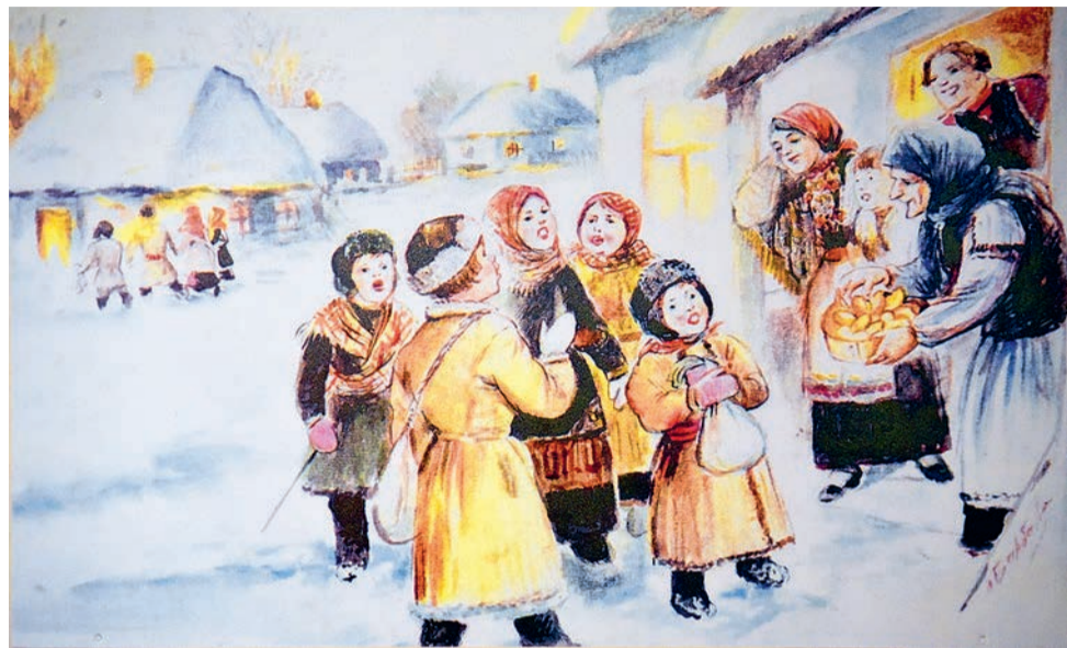
«Под Рождество. Колядование». Художник Леонид Барбарин.

► Крещение - один из 12 главных христианских праздников, согласно Евангелию в этот день Иисус Христос крестился в реке Иордан. При этом с ним связано очень много поверий и народных традиций, подчас далёких от православной веры.