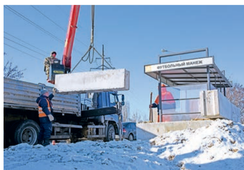
В городе появились новые укрытия