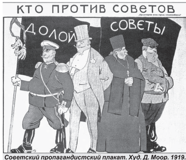
Советский пропагандистский плакат. Худ. Д. Моор. 1919.

Показательна система перевода учеников из одной ступени в следующую. Учащиеся, регулярно посещавшие занятия и получившие положительный отзыв от преподавателей, переводились на следующую ступень образования автоматически без сдачи зачётов и