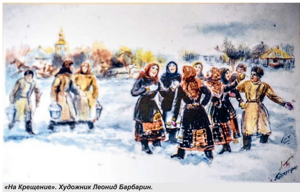
«На Крещение». Художник Леонид Барбарин.