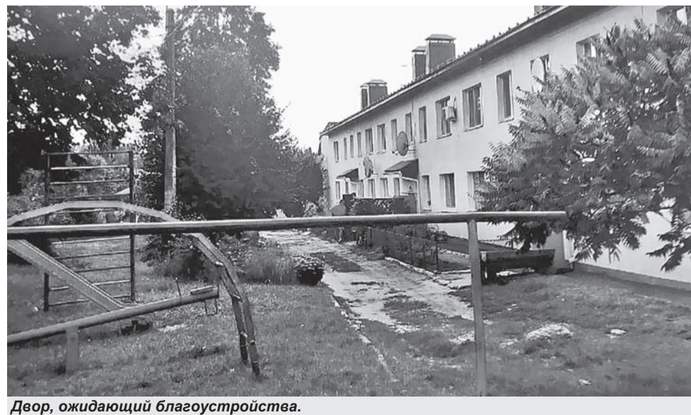
Двор, ожидающий благоустройства.