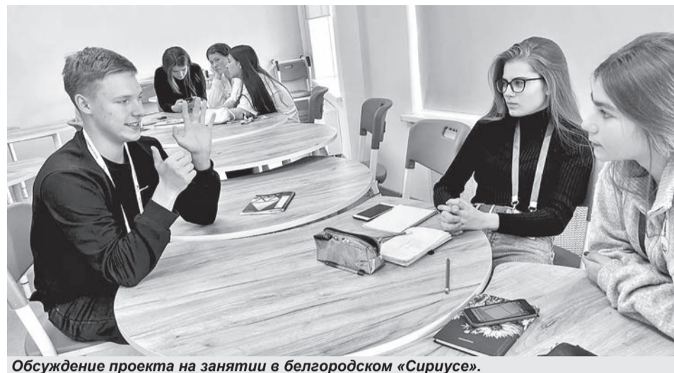
Обсуждение проекта на занятии в белгородском «Сириусе».

оформлена каждая рубрика и кто за какой контент будет отвечать, а ещё создали график, в котором было по дням расписано, что будет выходить. Например, в формате текста у нас две рубрики: «От первого лица», где мы связываемся со студентами, которые делятся советами и опытом сдачи экзаменов, и «Решаем ОГЭ», где мы тщательно разбираем задания основного государственного экзамена.