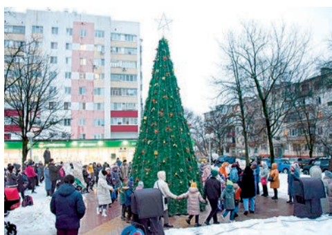
Праздники микрорайонов сближают соседей