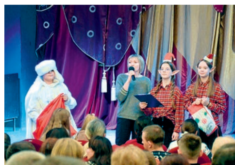
Театр кукол дарит сказку особенным детям