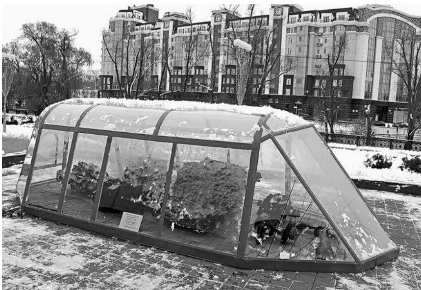
Новый экспонат музея-диорамы, ноябрь 2023 г.