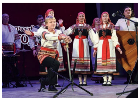
«Белгородский карагод» на страже традиций