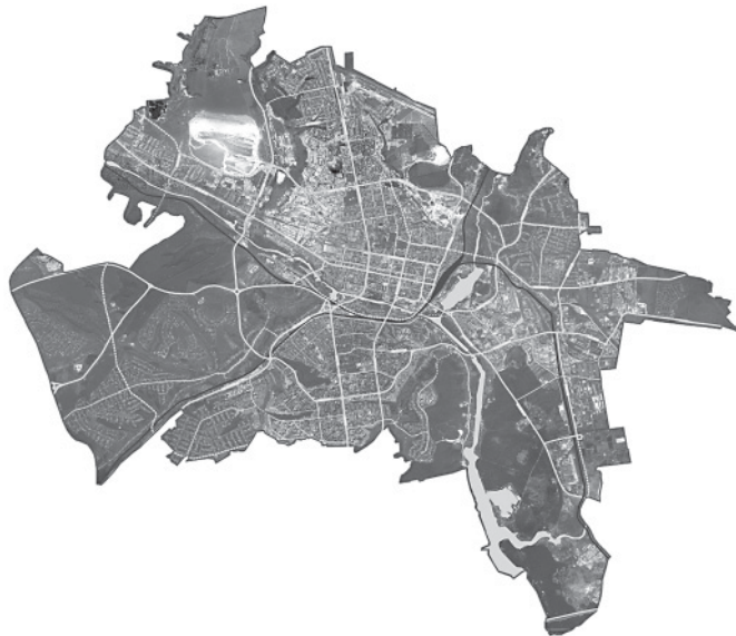
Рис. 1. Улично-дорожная сеть города Белгорода

Городской транспорт. Белгород обладает современной городской дорожно-транспортной инфраструктурой. Наличие развитой улично-дорожной сети и системы муниципального пассажирского транспорта обеспечивает транспортную связность территории городского округа (рисунок 1):