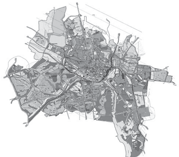
Рис. 3. Карта города Белгорода

Общественно-деловые зоны располагаются в основном в Центральном, Южном и Восточном районах города. Это городской общественный центр в Центральном районе и общественный центр Южного района. В этих зонах размещаются административные здания, банки, вузы и суззы, детские сады и школы, учреждения культуры, кинотеатры, магазины, предприятия общественного питания, учреждения здравоохранения и др.