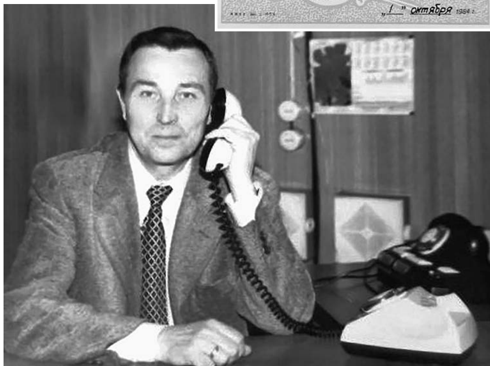
Северобайкальск, 1984 г.