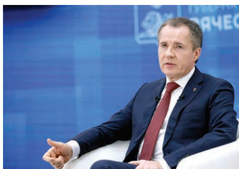
О развитии региона от первого лица