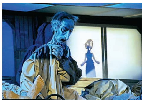
Премьера по Достоевскому в театре кукол