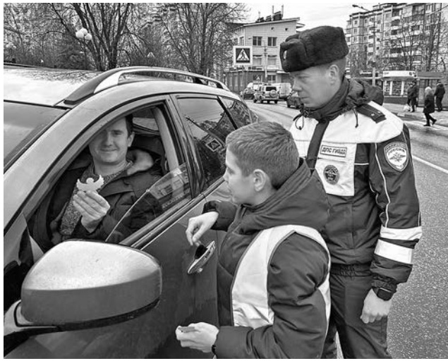
ФОТО ОГИБДД УМВД БЕЛГОРОДА

По данным ГИБДД, с начала года только с участием несовершеннолетних в возрасте до 16 лет на территории региона совершено 99 ДТП, в которых восемь детей погибли и 101 пострадал. В 45 случаях дети были пассажирами транспортных средств.