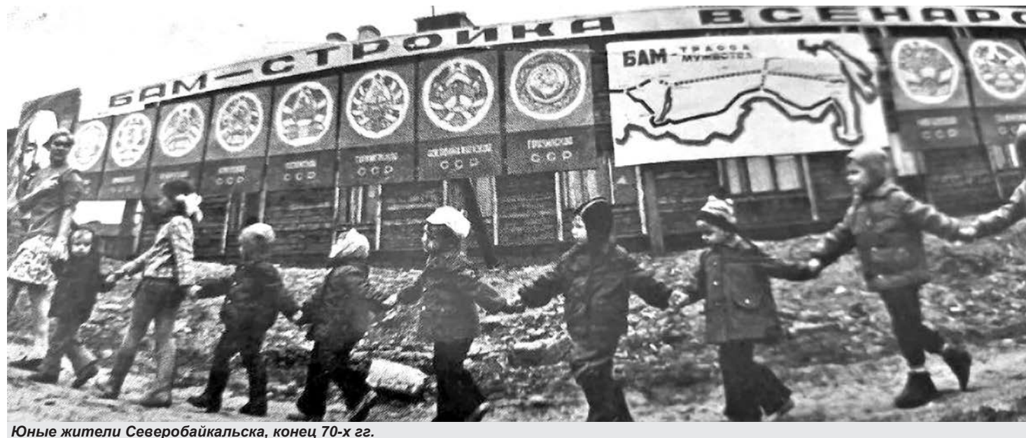
Юные жители Северобайкальска, конец 70-х гг.