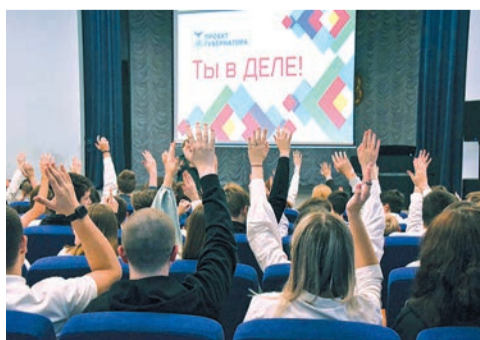
Детей научат предпринимательству