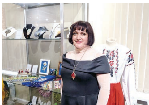
Умельцы отметили День народного мастера