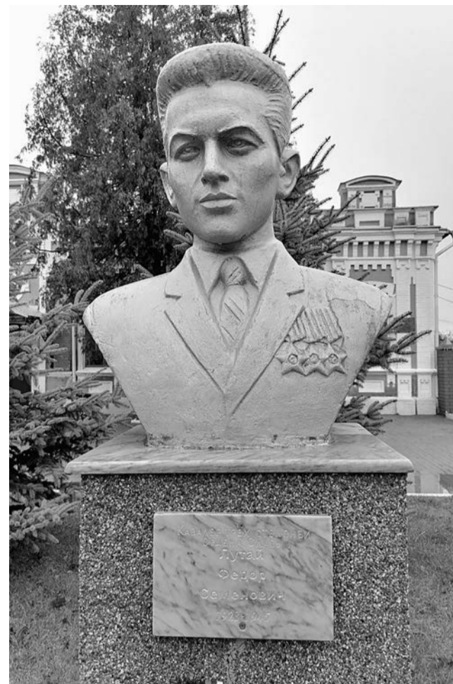
Бюст полного кавалера ордена Славы Фёдора Лутая в п. Борисовка.

вестно, что 19 августа того же года во время схватки с врагом он заменил командира, организовал выполнение боевой задачи и захватил пленного. Согласно Статуту ордена проявленные мужество и героизм могли быть отмечены орденом Славы III степени.