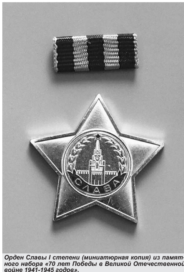
Орден Славы I степени (миниатюрная копия) из памятного набора «70 лет Победы в Великой Отечественной войне 1941-1945 годов».

Орденом Славы III степени был награждён 30 августа 1944 года за бой в районе с. Кемпе (Польша). Из-