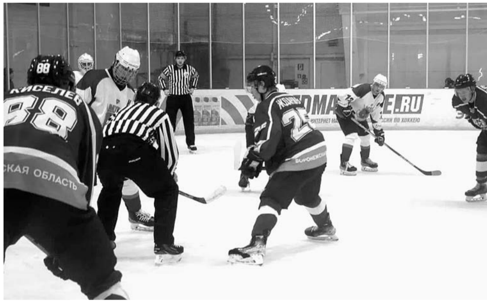
ФОТО ГРУППЫ МХК «БЕЛГОРОД» «ВКОНТАКТЕ»

Ближайшие матчи «Белгород» проведёт на домашнем льду против одного из лидеров конференции - Кирово-чепецкой «Олимпии» 11 и 12 ноября.