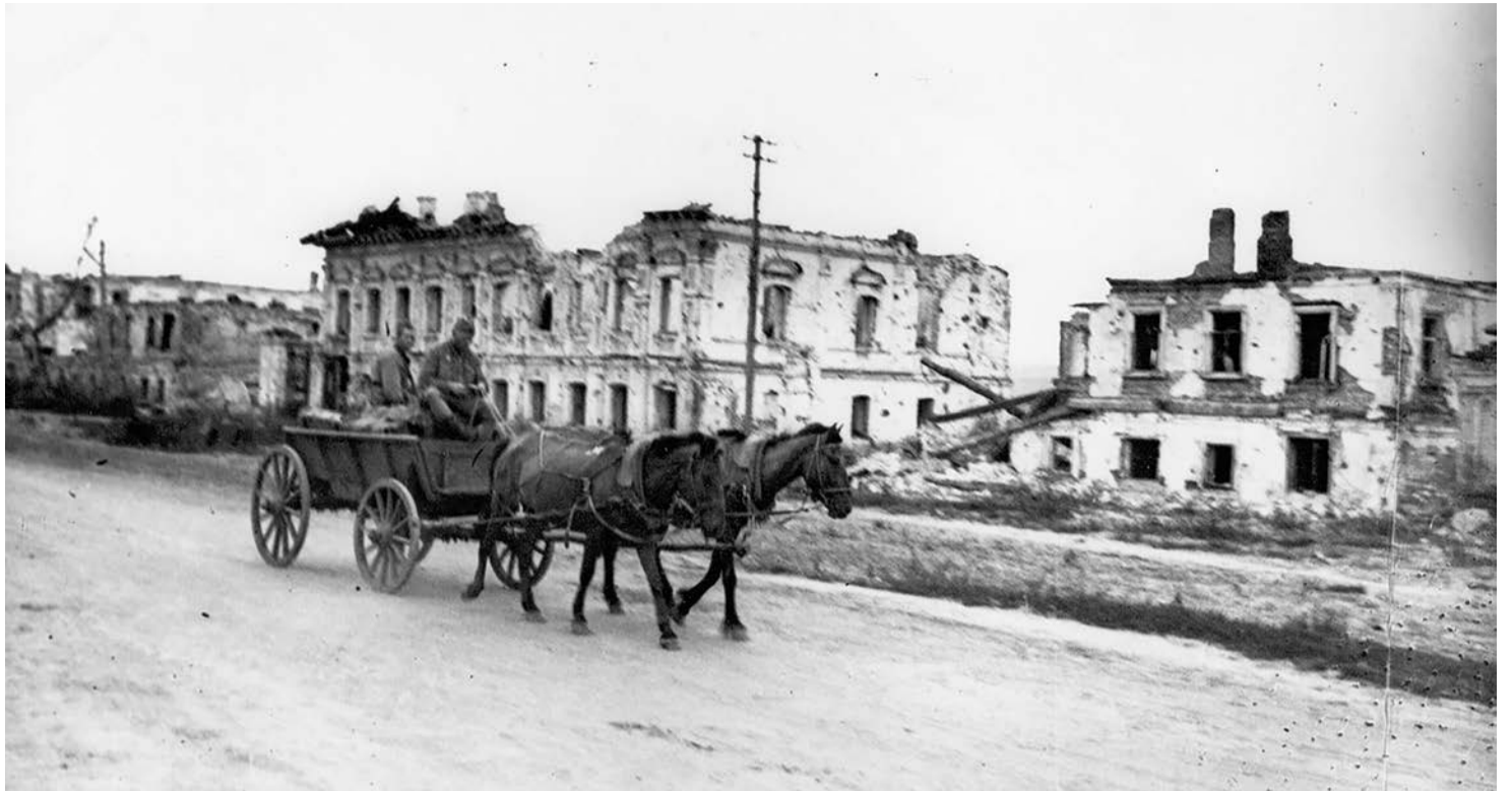
Одна из улиц освобождённого Белгорода, 1943 г.

После освобождения Белгорода от немецких оккупантов с первых дней были открыты поликлиника и больница на 35 коек. Спустя месяц больница имела уже 100 коек и терапевтическое, хирургиче-