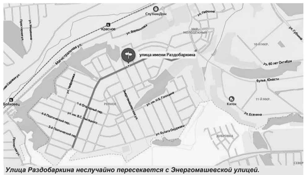
Улица Раздобаркина неслучайно пересекается с Энергомашевской улицей.