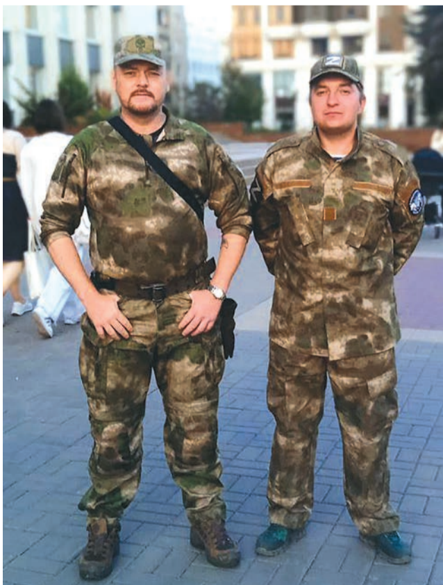
Бойцы «Ополчения 31» патрулируют улицы.