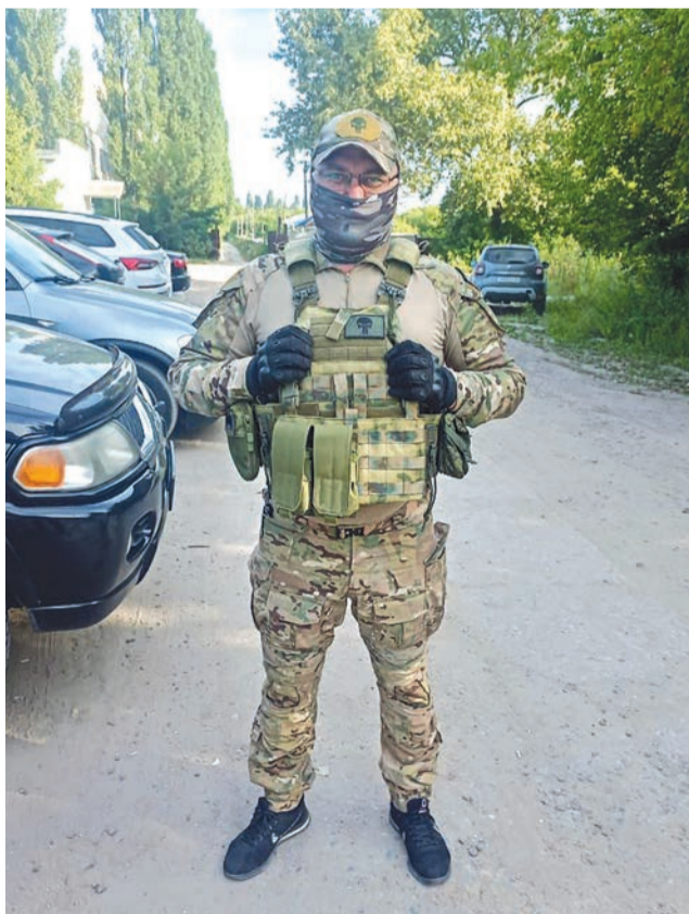
В составе «Ополчения 31» в основном мужчины в возрасте от 18 до 60 лет. Многие - с боевым опытом.

- Возрастные рамки - от 18 до 60 лет. Но мы всегда обозначаем круг задач и интересуемся уровнем подго-