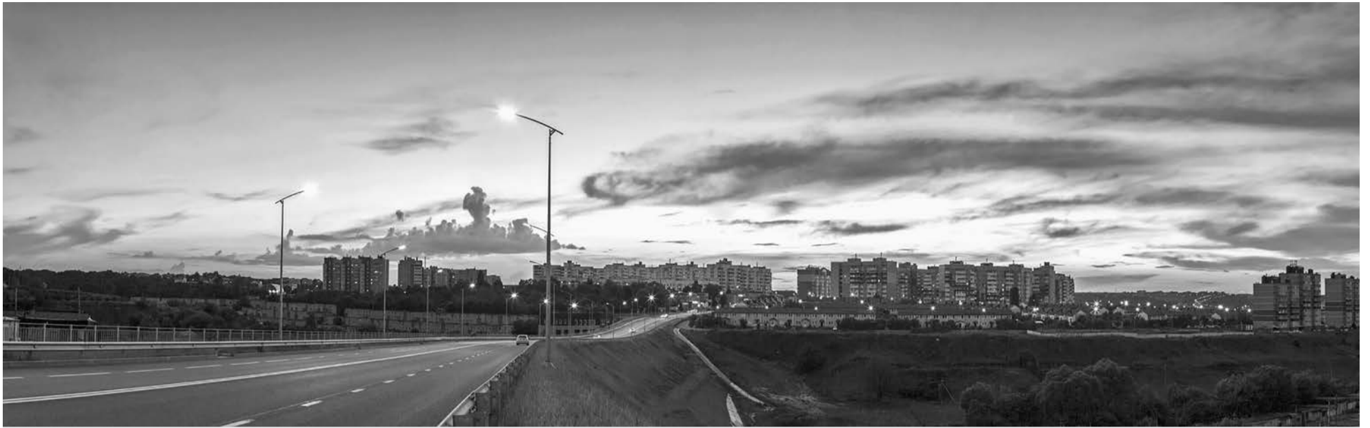
Так сегодня выглядит улица имени Раздобаркина.

гом стало создание ремесленного училища при заводе. Перед руководителем встал вопрос подготовки инженерно-технических работников, и тогда по инициативе Максима Раздобаркина в Белгороде строится и вводится в строй машиностроительный техникум, в который сразу же набирают первый курс из числа рабочих завода.