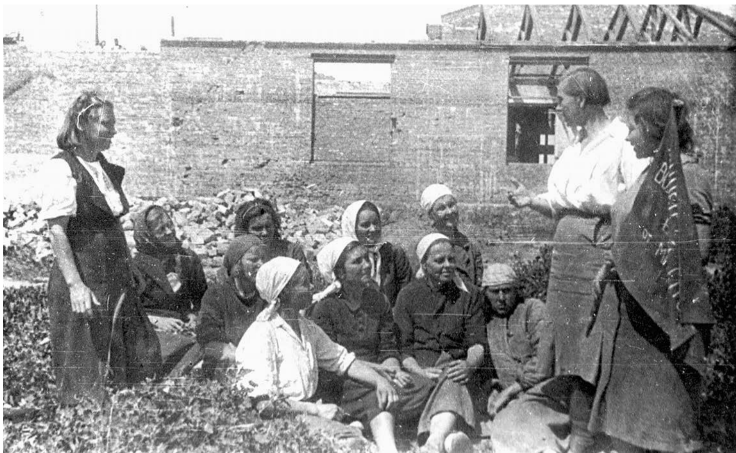
Одна из первых добровольческих восстановительных строительных бригад Белгорода. 1943 г.

Ценный документ, оказавшийся в фондах партийного архива Белгородской области, - докладная записка Белгородского горкома ВКП(б) «О мероприятиях по выполнению решения СНК СССР и ЦК ВКП(б) «О неотложных мерах по восстановлению хозяйства в районах, освобождённых от немецкой оккупации» - создан 4 сентября 1943 года. После освобождения Белгорода прошло всего около месяца.... Каким