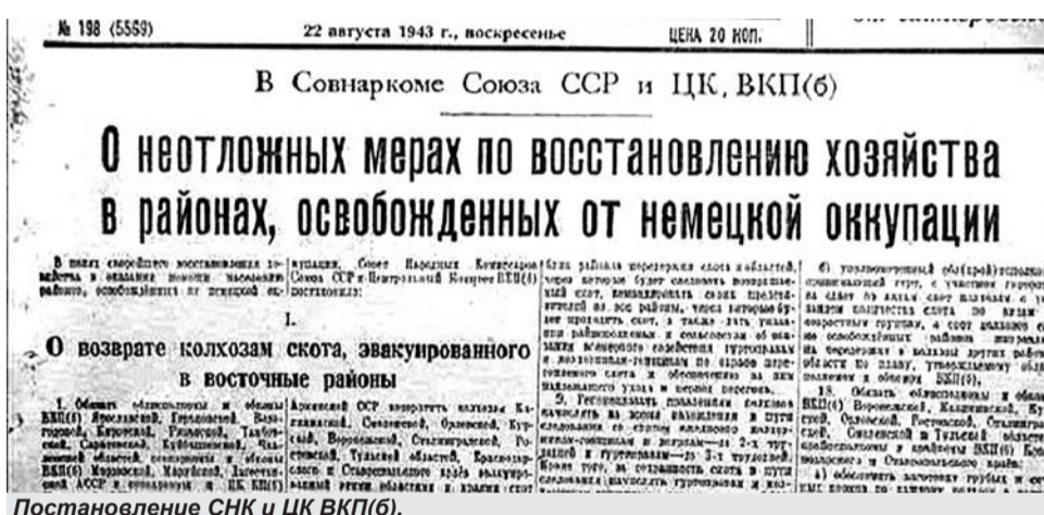
Постановление СНК и ЦК ВКП(б).

же был город к сентябрю 1943 года? Что успели сделать белгородцы?