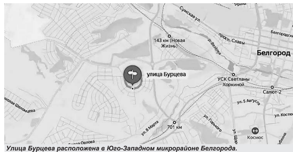
Улица Бурцева расположена в Юго-Западном микрорайоне Белгорода.

Владимир Васильевич совершил подвиг, пойти на который могут исключительно смелые и мужественные люди, верные своему служебному долгу и своей Родине. Его жизнь и слова никогда не расходились с делами. Сослуживцы отмечали его хорошее отношение ко всем окружающим, при этом подчёркивали упорство и настойчивость в достижении поставленных целей. Он всегда оставался простым человеком, справедливым руководителем, настоящим боевым офицером, который никогда не оставит своих в беде.