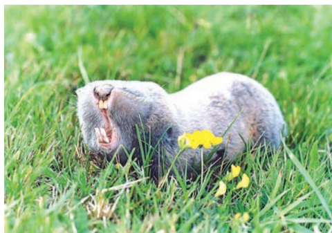
Кто живёт под землёй