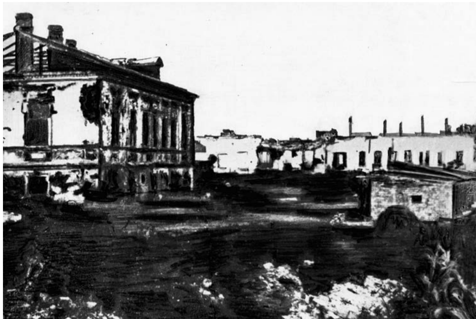
Железнодорожная поликлиника (в центре) на улице Ленина (ныне Гражданский проспект) после освобождения города Белгорода от гитлеровцев, 1943 г.

Получить представление о повреждении зданий и имущества учреждений и организаций Белгорода позволяют акты ущерба, причинённого немецко-фашистскими захватчиками и их сообщниками. В подобном документе, составленном Белгородским городским отделом здравоохранения (горздравотделом), отмечалось: «От сильной бомбардировки на протяжении семи суток в марте месяце 1943 года разрушены корпуса больниц и объектов вспомогательного хозяйства. Имущество разграблено и уничтожено». Пострадали корпуса городской больницы на улицах Сталина (ныне часть улицы Преображенской) и Первомайской, железнодорожные поликлиника и больница и многие другие здания.