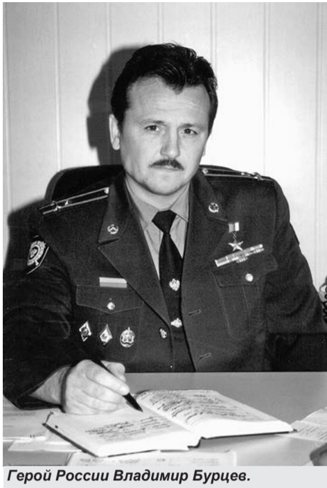
Герой России Владимир Бурцев.