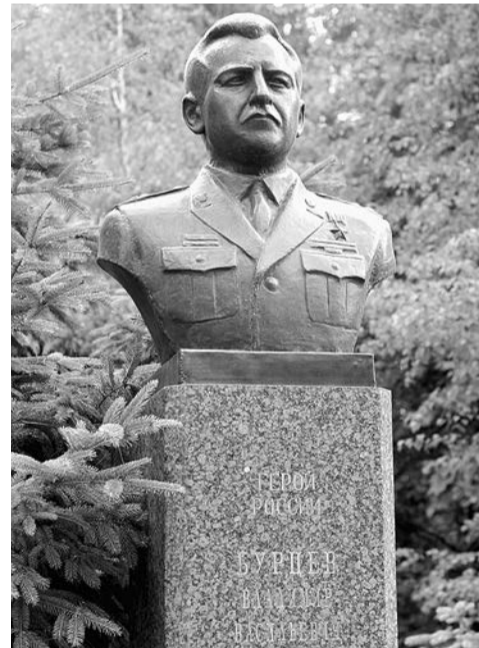
Бюст Владимира Бурцева установлен в Белгороде на Аллее Героев.

Вся жизнь Владимира Бурцева - это яркий пример служения своему Отечеству. В музее УМВД представлены фотографии, документы и личные вещи героя.