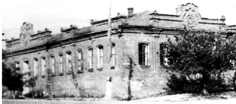
Восстановленное здание городской поликлиники на улице Новомосковской (ныне - проспект Богдана Хмельницкого), 1948 г.