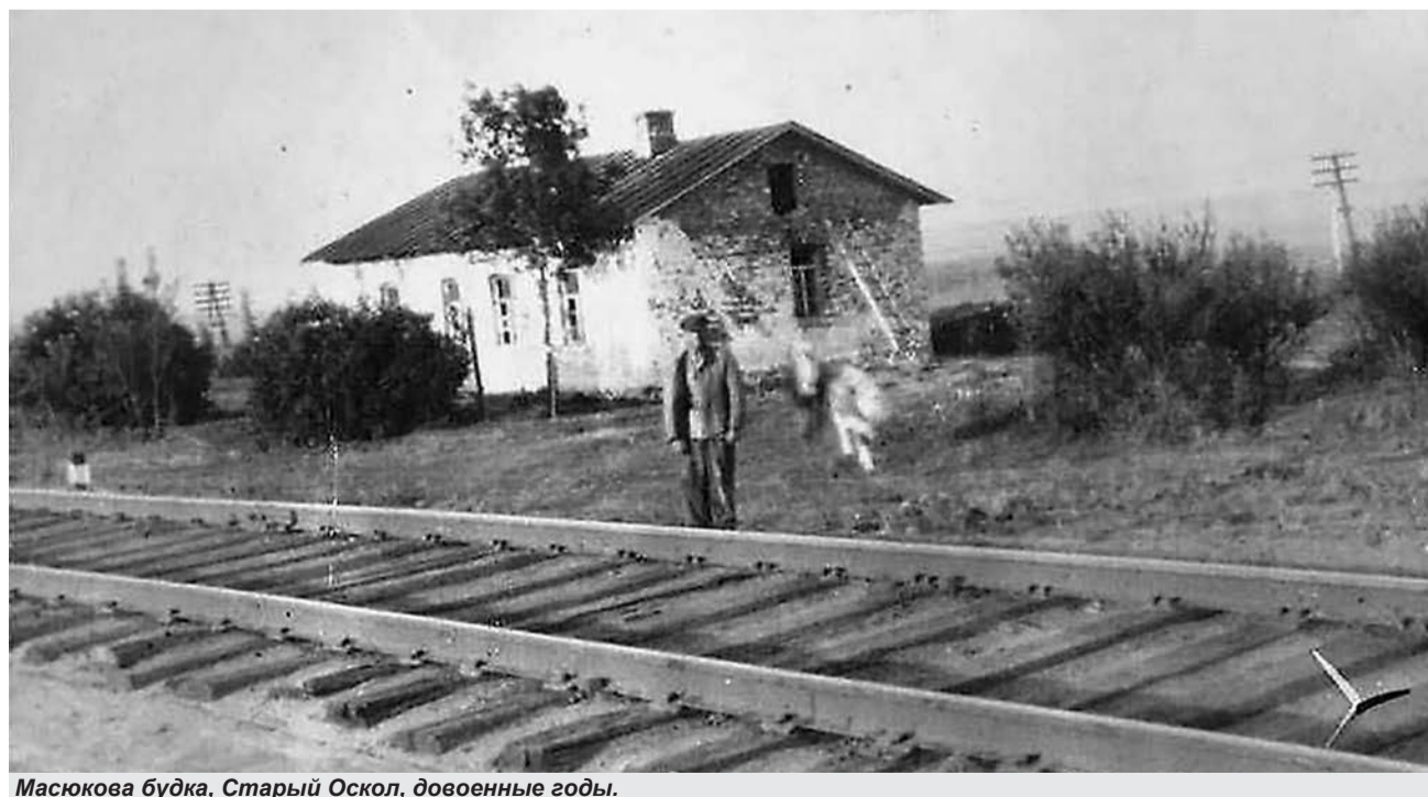
Масюкова будка, Старый Оскол, довоенные годы.