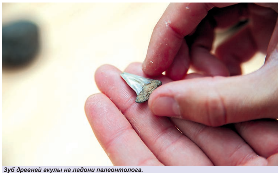
Зуб древней акулы на ладони палеонтолога.

Беседовал Вадим КУМЕЙКО