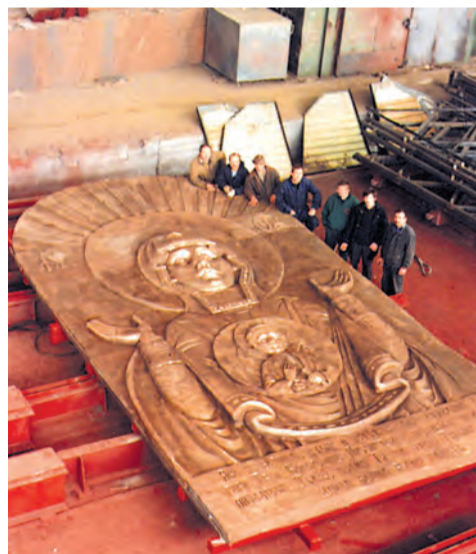
В цехе отгрузки готовой продукции Белгородского ЗМК.