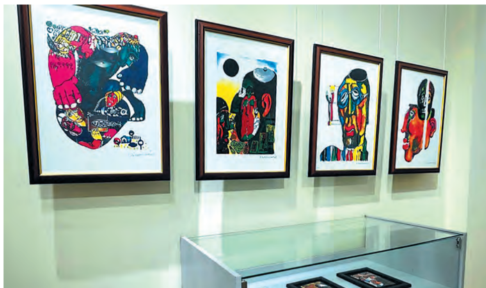
Работы Зураба Церетели в Белгороде.