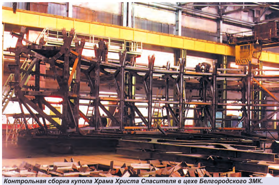
Контрольная сборка купола Храма Христа Спасителя в цехе Белгородского ЗМК.