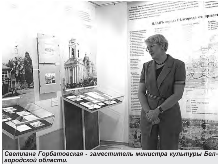
Светлана Горбатовская - заместитель министра культуры Белгородской области.