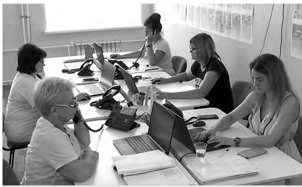
Сотрудники колл-центра городской поликлиники за работой.

Полную версию интервью можно посмотреть по ссылке