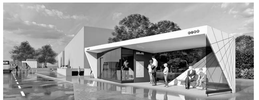
Материалы полосы подготовил Виктор ФЁДОРОВ

Подробнее о городских событиях читайте и смотрите в сюжетах на сайте belnovosti.ru