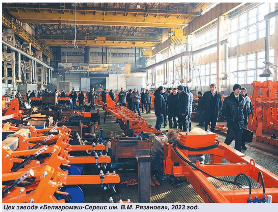
Цех завода «Белагромаш-Сервис им. В.М. Рязанова», 2023 год.

Подготовил Павел ПЕРЕДЕРИЙ