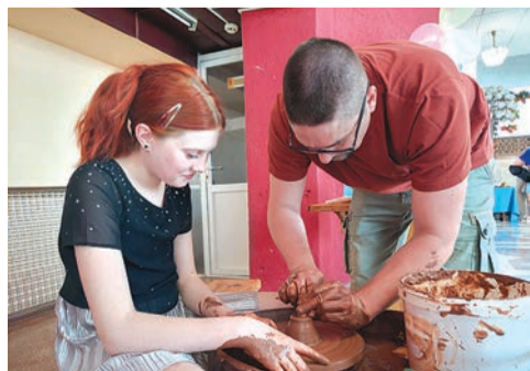
Фестиваль «Живая глина»