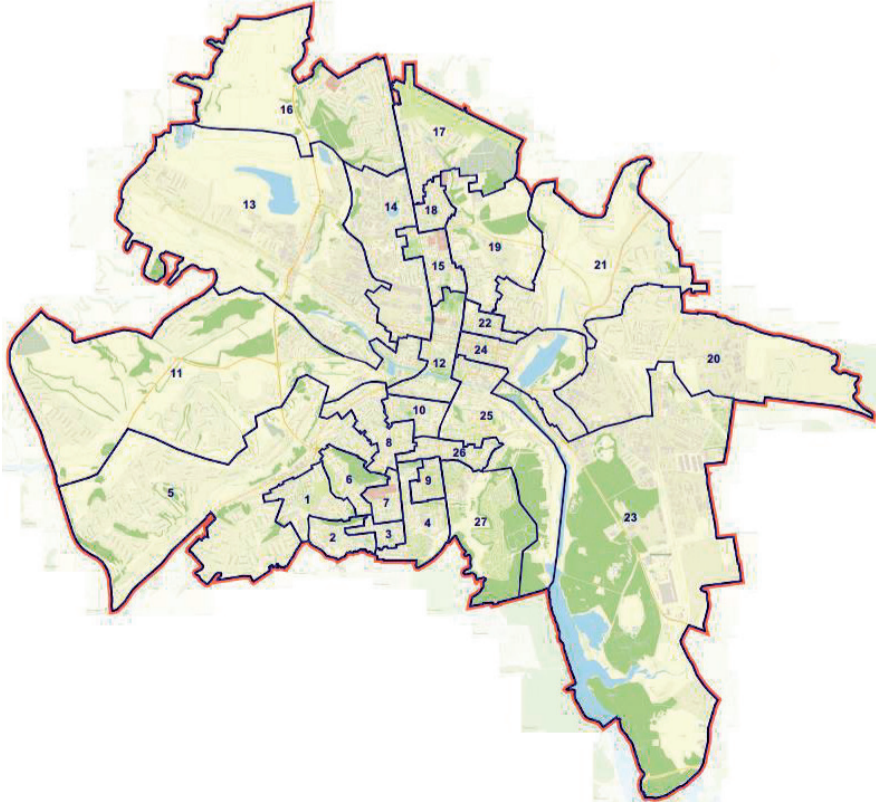
Схема одномандатных избирательных округов на территории городского округа «Город Белгород»