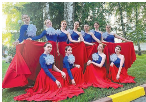
Как артисты поддержали шебекинцев