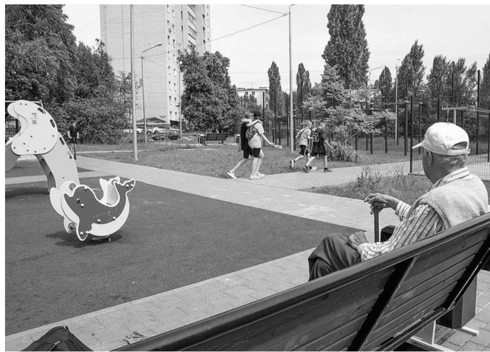
Материалы полосы подготовила Анна БАРАБАНОВА