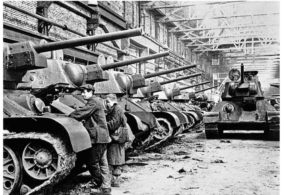
Челябинский танкоград, 1942 г.

К его решению в семье отнеслись по-разному: отец поддержал, мама до сих пор не одобряет, волнуясь за сына, младший братишка с интересом расспрашива-