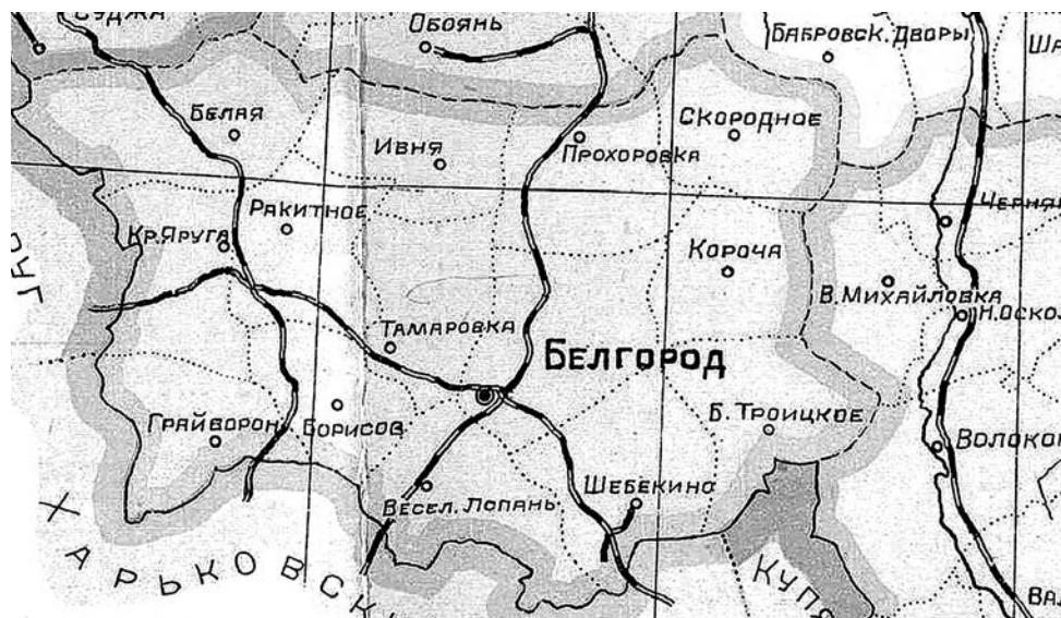
Карта Белгородского округа по состоянию на 1928 год.