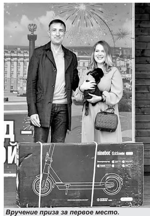
Вручение приза за первое место.

► В Белгороде подвели итоги конкурса «Река в цвету».