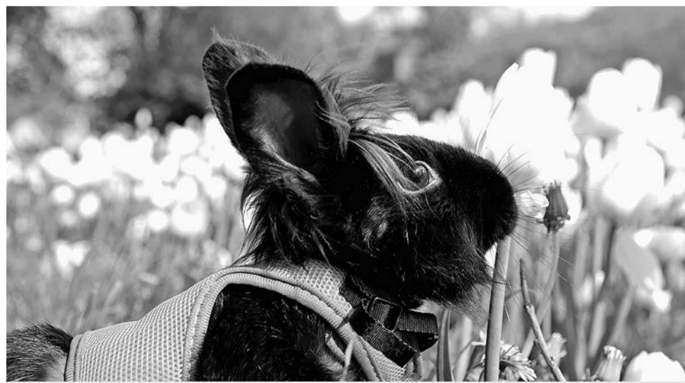
Одна из работ победительницы фотоконкурса «Река в цвету».

Напомним, фотоконкурс проводился в рамках фестиваля «Река в цвету». Главным объектом съёмки стали тюльпаны, наполнившие город в первые майские выходные. Гости праздника запечатлели яркие краски и эмоции весеннего торжества и выложили их на своих