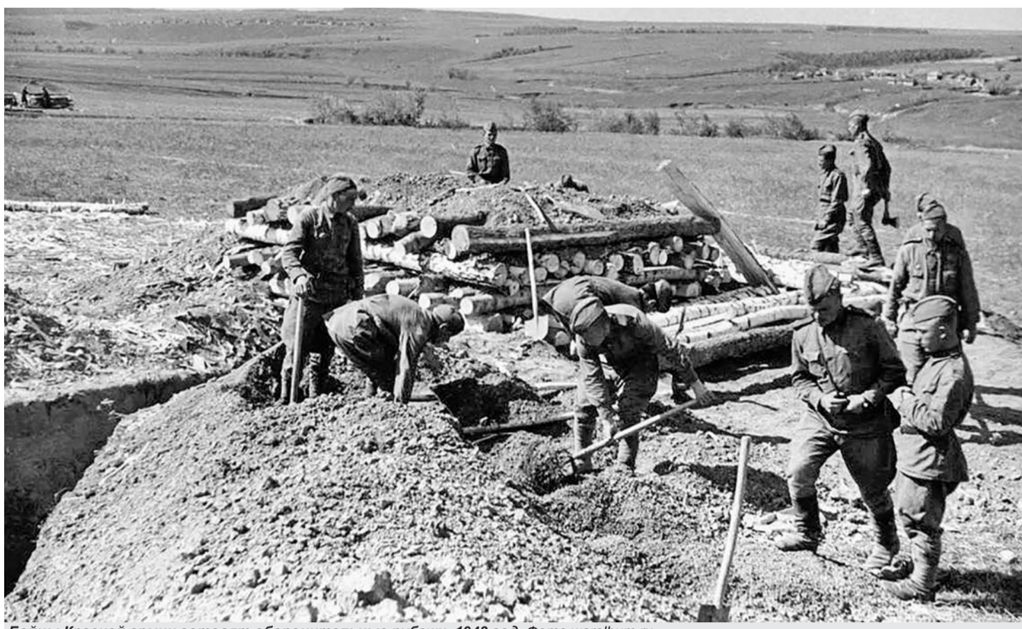
Бойцы Красной армии готовят оборонительные рубежи, 1943 год.

По решению Георгия Жукова, который в марте - апреле часто бывал в войсках фронта и лично проводил рекогносцировку местности в полосе 7-й гвардейской армии вместе с командующим Воронежским фронтом Николаем Ватутиным, наиболее прочно укреплялся передний край главной полосы обороны на правом крыле 25-го гвардейского стрелкового корпуса прямо напротив города. В ночь с 4 на 5 мая сюда в первый эшелон вывели 81-ю гвардейскую стрелковую дивизию, сменив значительно обескровленную в беспорывных попытках отбить село Михайловку 73-ю гвардейскую стрелковую дивизию. С этого времени 81 ГСД была единственной в 7-й гвардейской армии, которая при-