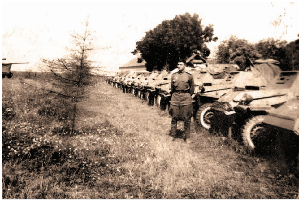
Бронетанковая рота перед Прохоровским сражением. 9 июля 1943 г.

Наши соотечественники не только жертвовали своими жизнями, но и сплочённые идеей защиты Родины от врага познавали в боевом братстве ценность человеческой жизни, настоящей дружбы и товарищества: «...В рядах наступающих