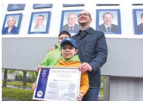
На Доске почёта - лучшие из лучших