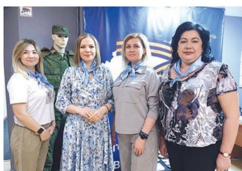
Поддержка матерей и жён военнослужащих