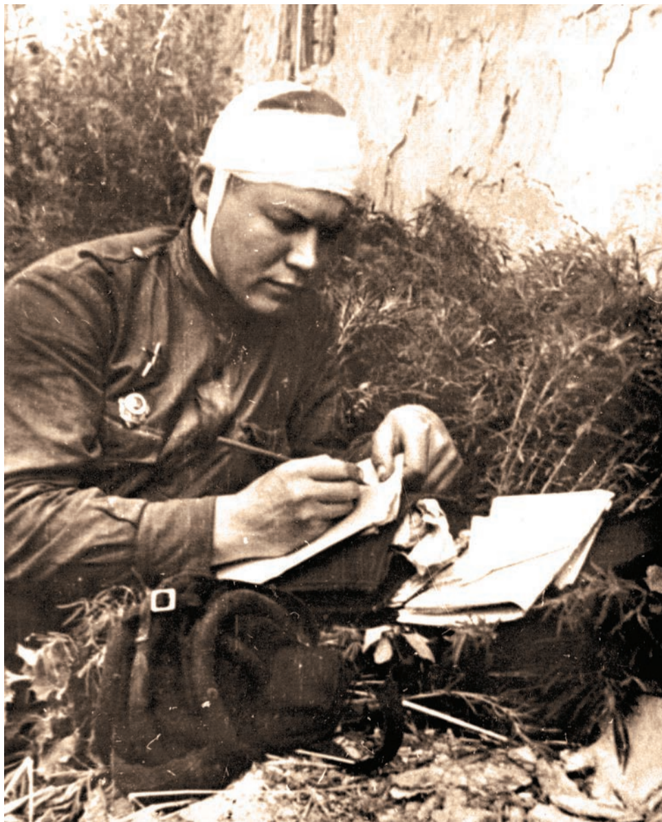
Белгородское направление. Раненый танкист пишет письмо. Июль 1943 г.

В июле 1942 года был направлен на должность заместителя командира по политической части артиллерийского дивизиона 159 гвардейского (в то время краснознаменного) артиллерийского полка 75 гвардейской стрелковой дивизии в звании старшего лейтенанта. Так начался его фронтный путь.