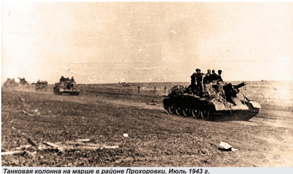
Танковая колонна на марше в районе Прохоровки. Июль 1943 г.