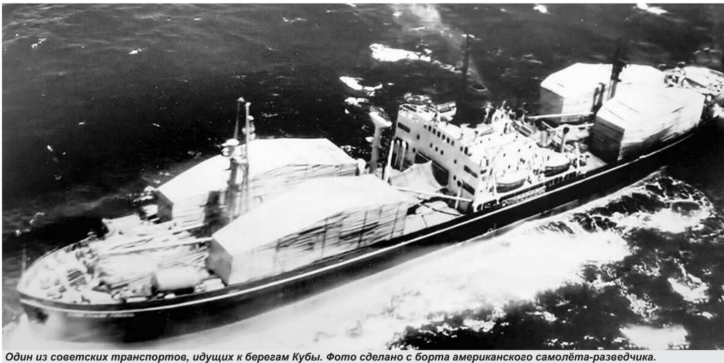
Один из советских транспортов, идущих к берегам Кубы. Фото сделано с борта американского самолёта-разведчика.