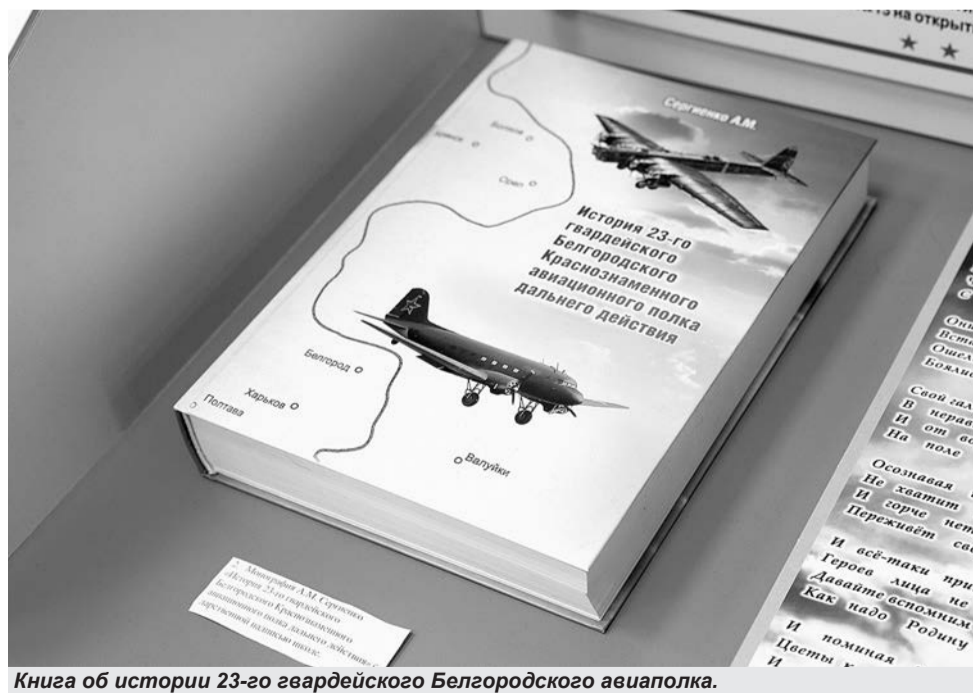
Книга об истории 23-го гвардейского Белгородского авиаполка.