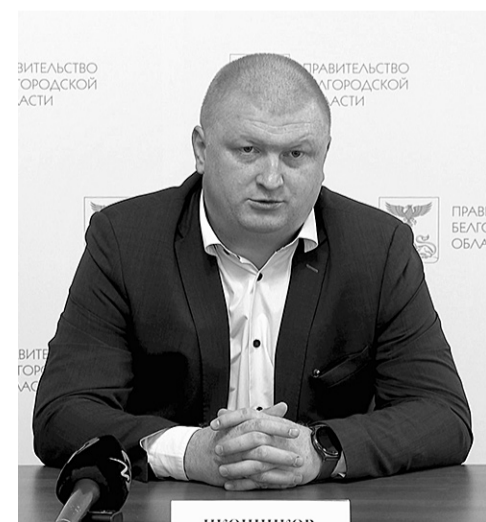
Материалы полосы подготовил Павел ПЕРЕДЕРИЙ

Подробнее о городских событиях читайте и смотрите в сюжетах на сайте belnovosti.ru