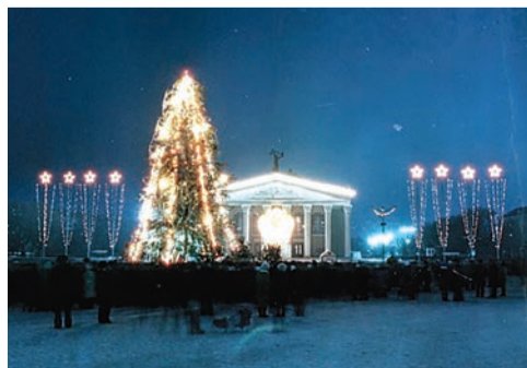
Эволюция белгородских ёлок