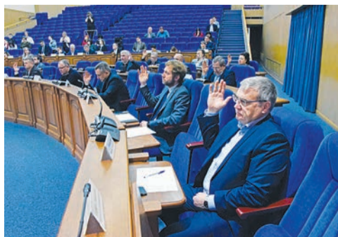
Городской бюджет принят