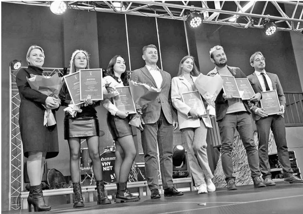
По итогам конкурса целая россыпь наград досталась журналистам холдинга «Белгород-медиа».

► 16 декабря в культурном центре «Октябрь» подвели итоги городского конкурса на лучшее освещение в СМИ деятельности органов местного самоуправления Белгорода. Администрация города проводит конкурс для журналистов с 2015 года. В этот раз члены жюри оценивали 82 работы сотрудников телевизионных, сетевых и печатных средств массовой информации в пяти номинациях.