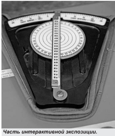
Часть интерактивной экспозиции.