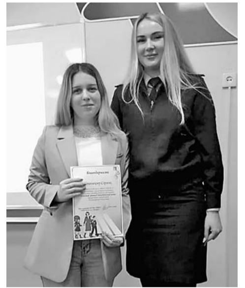
ФОТО ПРЕСС-СЛУЖБЫ УМВД ПО БЕЛГОРОДУ

Лучших педагогов-организаторов, кураторов и руководителей ЮИДовских отрядов наградили представители управления образования и Госавтоинспекции. Рейтинг профильных педагогов стал стимулом для повышения качества подготовки школьников и организации работы ЮИДовских отрядов. С каждым годом это движение набирает обороты в нашем в городе, а желающих вступить в отряды юных инспекторов движения становится больше.