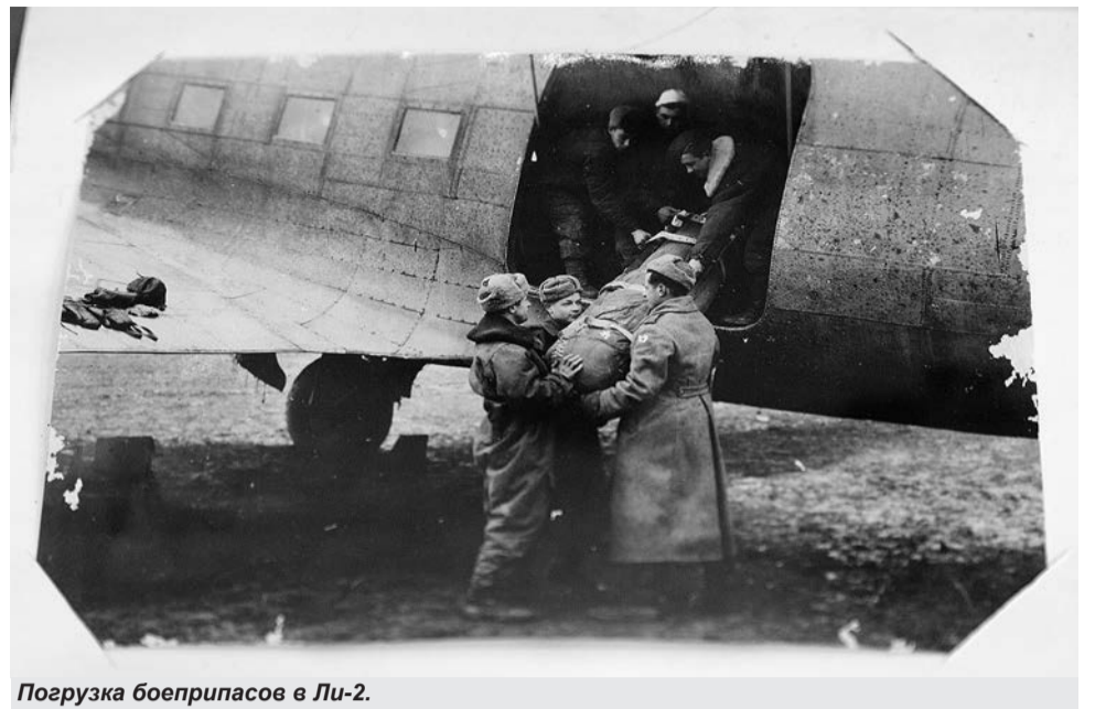
Погрузка боеприпасов в Ли-2.

«Наша машина загорелась на втором заходе, уже при отходе от цели. Командир экипажа приказал прыгать. Все, кто мог, выпрыгнули... При наборе скорости свободного падения меня стало крутить. Левую руку прижало к бедру, и я ощутил колюще. Я его потянул, и парашют раскрылся. Только принял нормальное положение, как заметил немецкого истребителя. Он дал по мне очередь, но промахнулся. Иду на хитрость: опускаю