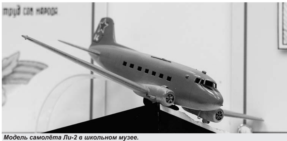
Модель самолёта Ли-2 в школьном музее.

Разве не 23-й гвардейский авиаполк АДД носит имя этого города?