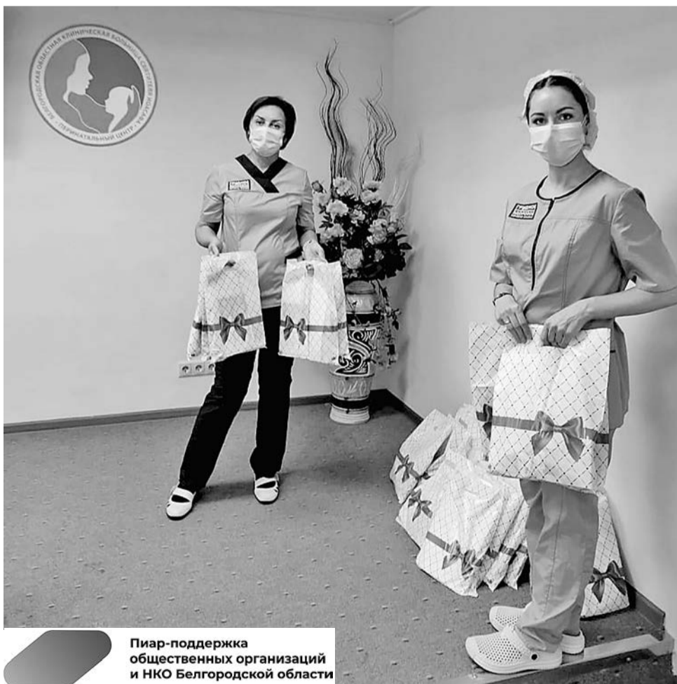
Пиар-поддержка общественных организаций и НКО Белгородской области