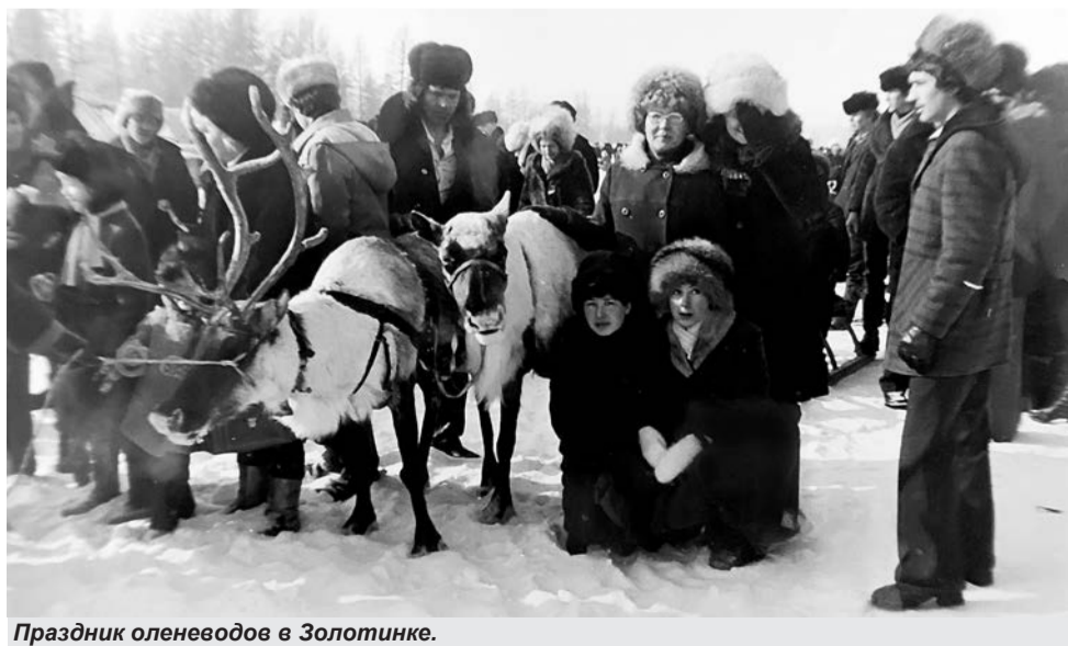
Праздник оленеводов в Золотинке.