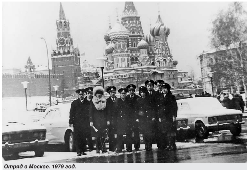
Отряд в Москве. 1979 год.

Тында встретила их 35-градусным морозом. Молодёжь к этому не была готова. Девчонки принарядись в тонкие чулки, а ребята из Армении были в фуражках и туфлях. Понимая это, организаторы постарались не затягивать торжественную церемонию. Прибыв-