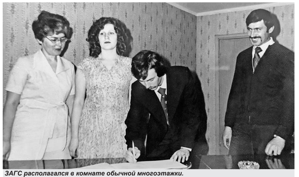
ЗАГС располагался в комнате обычной многоэтажки.