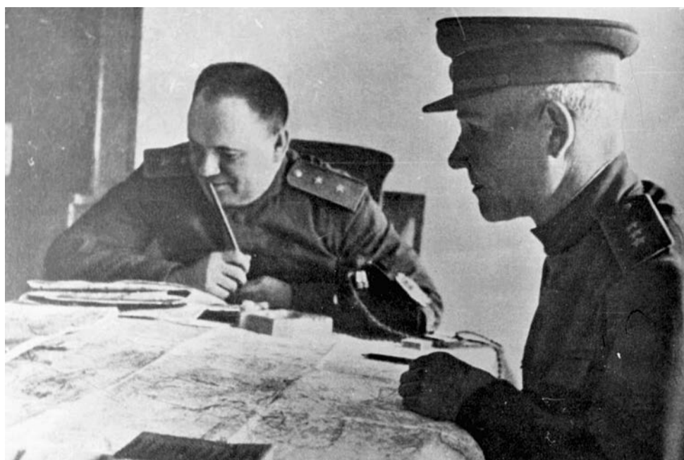
Командующий войсками Степного фронта Иван Конев (справа) и начальник штаба Матвей Захаров. Курская дуга, лето 1943 г.