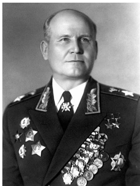
Маршал Советского Союза Иван Конев. 1947 г.