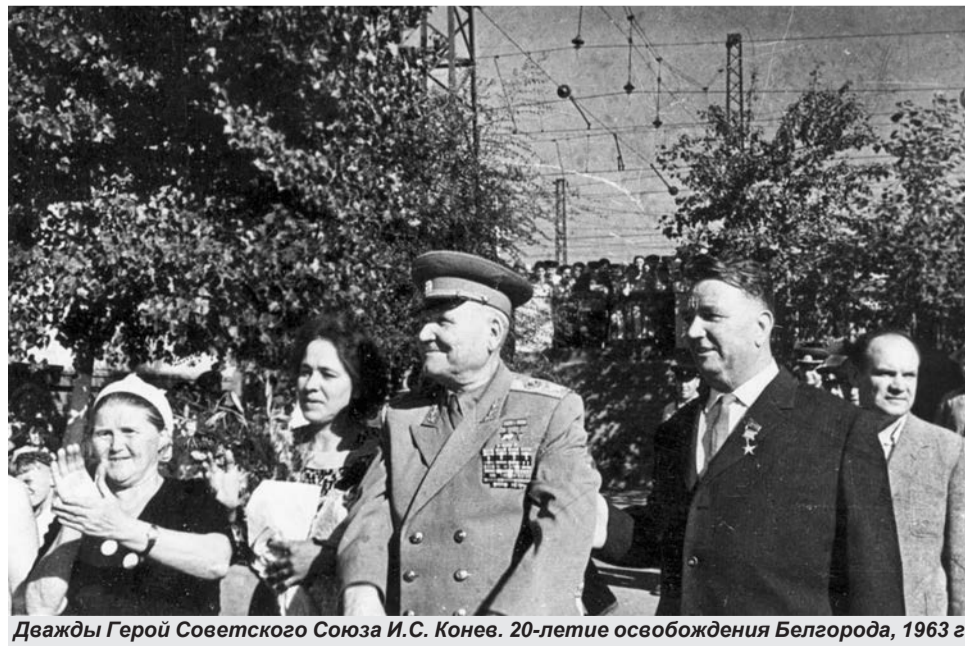
Дважды Герой Советского Союза И.С. Конев. 20-летие освобождения Белгорода, 1963 г.

Основные праздничные мероприятия проходили в воскресенье, 4 августа. В 10 часов утра военная делегация по главе с Иваном Коневым приняла участие в митинге у памятника танкистам недалеко от посёлка Яковлево. Маршал Конев и генерал Шумилов возложили к мемориалу венки от Министерства обороны СССР. Затем Иван Степанович, офицеры, советские и партийные работники отправились в Парк Курской дуги.