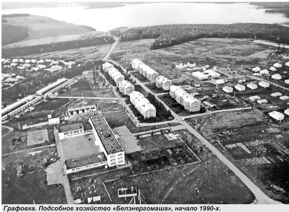
Графовка. Подсобное хозяйство «Белэнергомаша», начало 1990-х.