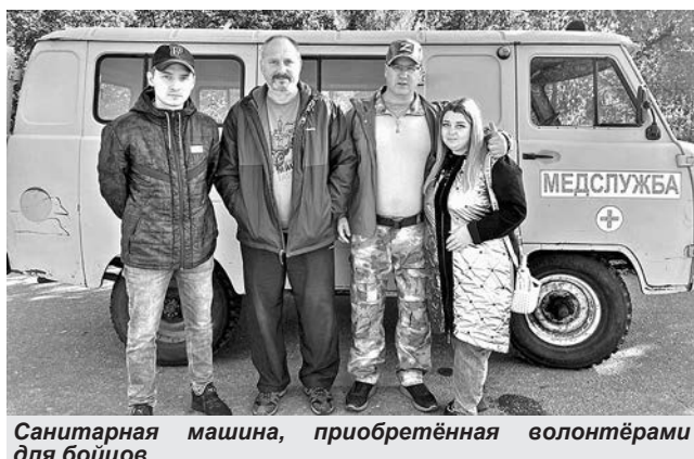
Санитарная машина, приобретённая волонтерами для бойцов.