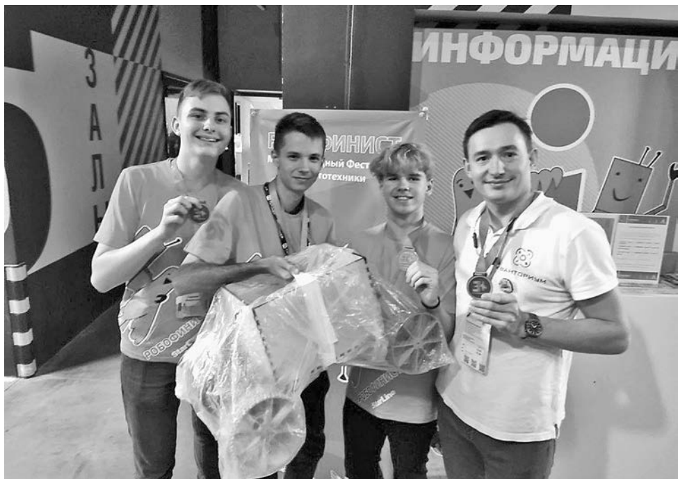
Материалы полосы подготовил Юрий АНДРЕЕВ