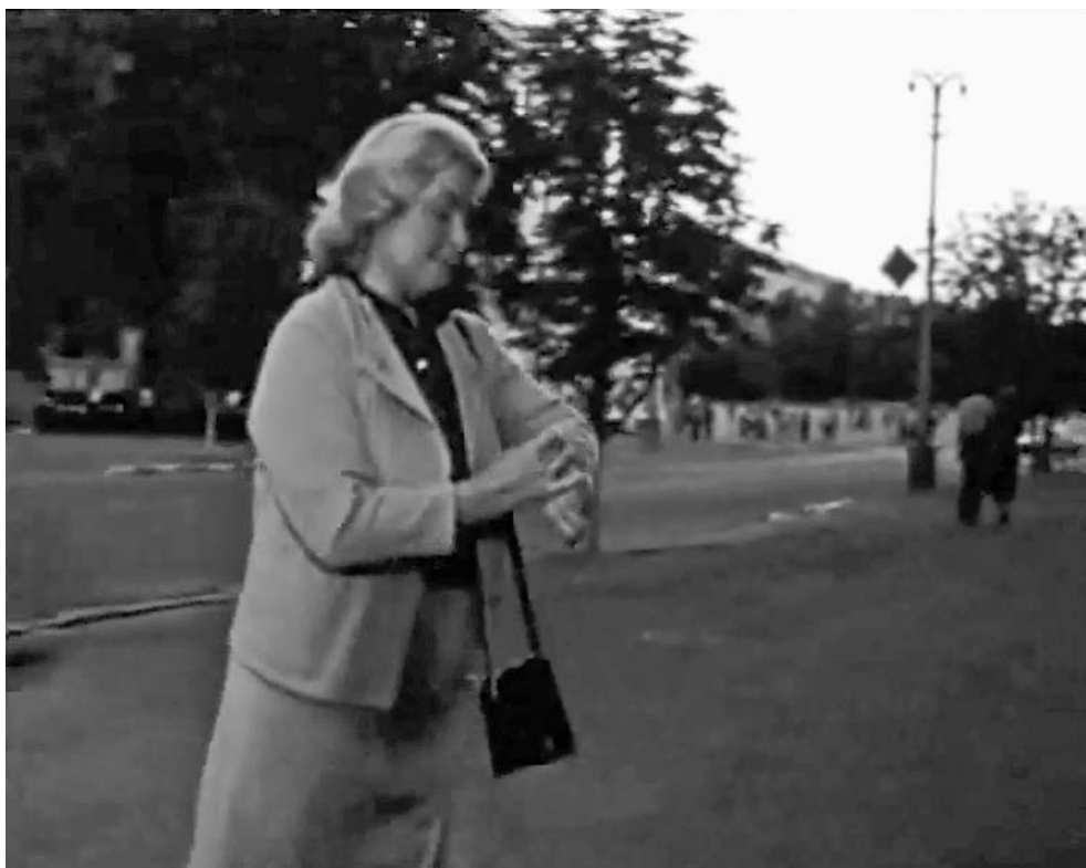
Героиня Лидии Федосеевой-Шукшиной идет по улице Белгорода (слева). Так это место выглядит сейчас (справа).

ранов. - Нас пригласили в ликвидируемое хозяйство колхоза «Большевик». После первого визита мы были разочарованы, но ничего другого нам не могли предложить. Этот колхоз не просто «лежал на боку» - там вообще ничего не было. Главным вопросом, который интересовал колхозников, была даже не заработная плата. Люди просили сделать так, чтобы они могли поехать к врачу, на железнодорожную станцию. На всей территории колхоза «Большевик» не было ни одного квадрат-