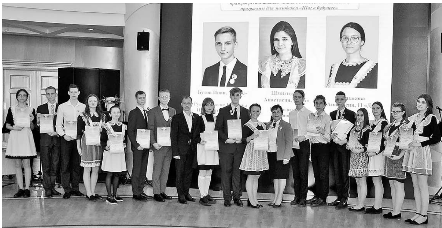
Лучшие лицеисты по итогам завершившегося учебного года.