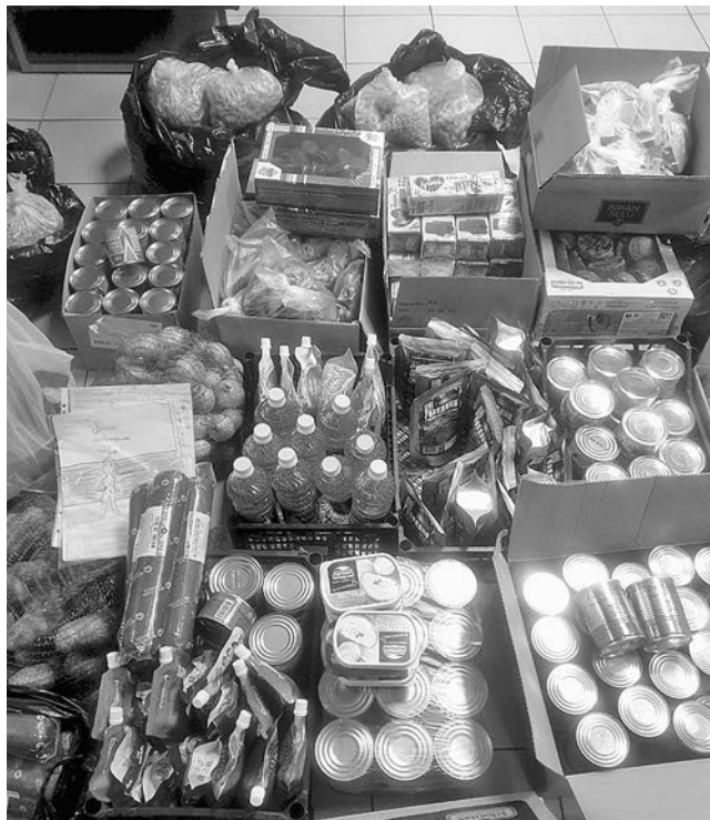
Гуманитарная помощь для военных.