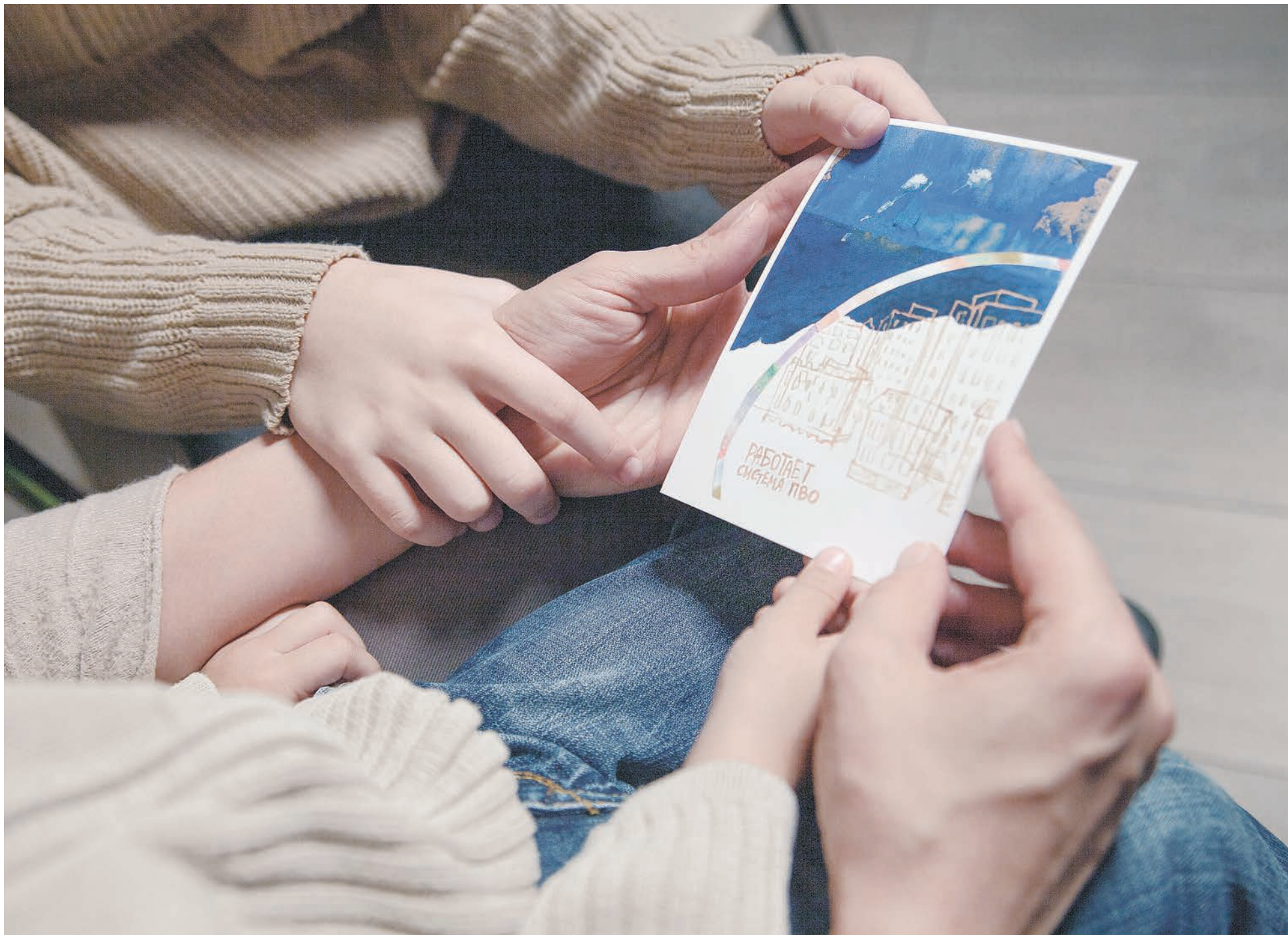
АВТОР ОТКРЫТКИ - БЕЛГОРОДСКАЯ ХУДОЖНИЦА АНАСТАСИЯ САВИЦКИХ