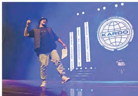
Праздник уличной культуры