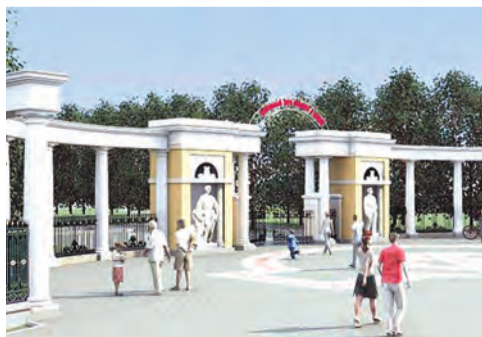
Какими будут белгородские парки