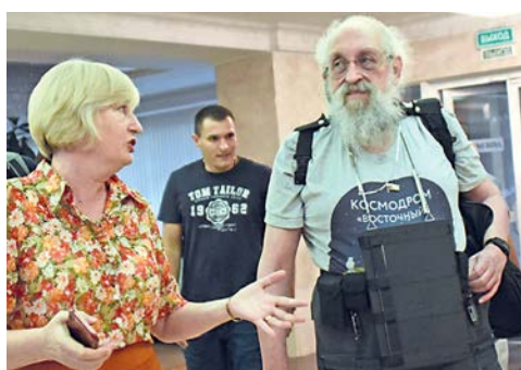
Анатолий Вассерман в Белгороде