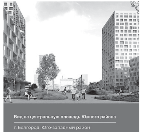
Вид на центральную площадь Южного района

В Юго-Западном микрорайоне предложено создать развитую социальную инфраструктуру. Она будет включать два медицинских учреждения, девять детских садов и пять общеобразовательных школ. Кроме того, в этой части Белгорода должен быть размещён IT-парк.