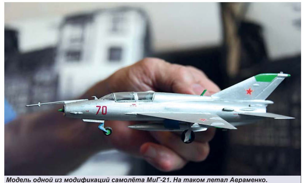
Модель одной из модификаций самолёта МиГ-21. На таком летал Авраменко.

РЕКЛАМА ПОЗДРАВЛЕНИЯ ОБЪЯВЛЕНИЯ Тел.: 23-14-42 На правах рекламы