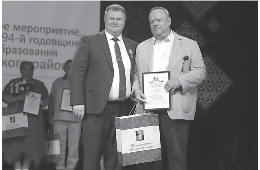
ФОТО ПРЕСС-СЛУЖБЫ АДМИНИСТРАЦИИ БЕЛГОРОДСКОГО РАЙОНА

► В Белгородском районе прошли торжества, посвящённые 79-й годовщине освобождения Белгорода и ближайших районов от немецко-фашистских захватчиков.