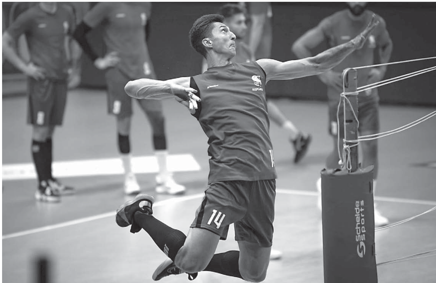
ВК «Белогорье» готовится к новому сезону.

М.А.Х.: Я успел поиграть во многих странах, но в России мне очень нравится. Эта страна входит в топ-3 мест, в которых мне понравилось играть. Здесь