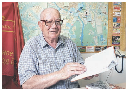
На страже памяти