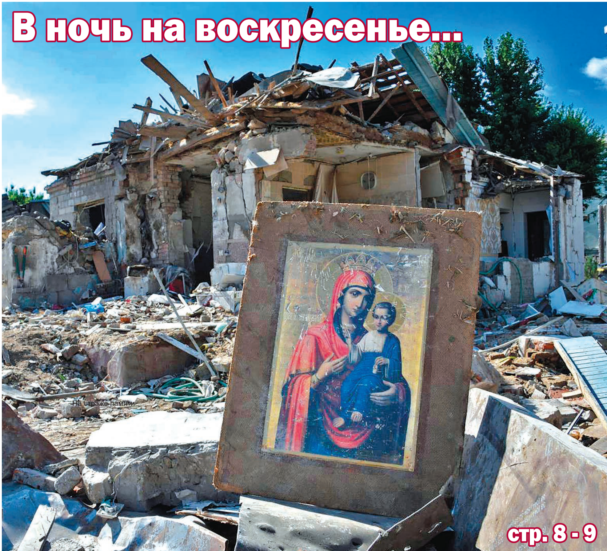
На страже памяти