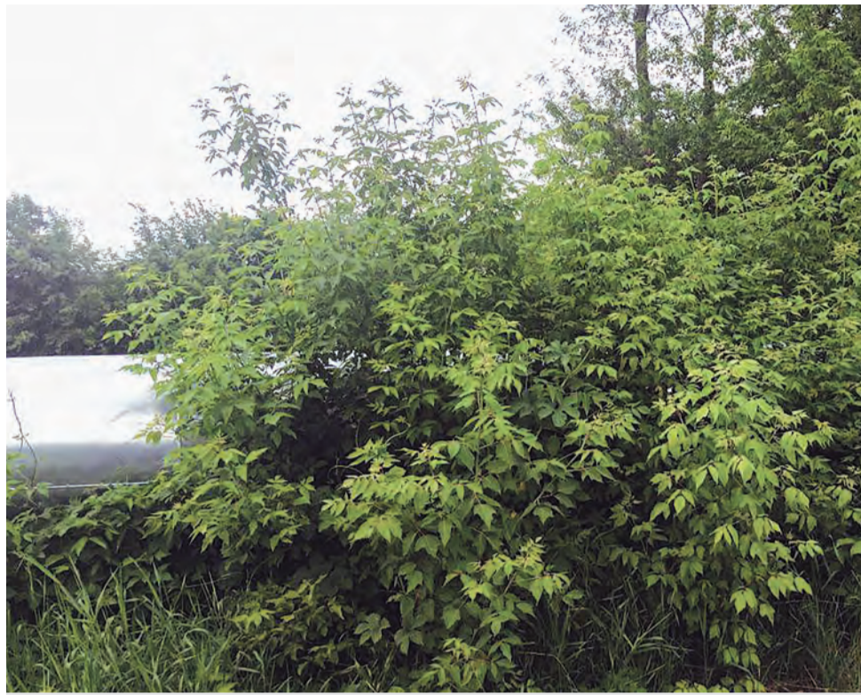
Американский клён распространён повсеместно.

В Белгороде клён появился точно так же, как и все растения. Судя по размерам стволов некоторых экземпляров, они были высажены в период восстановления города после Второй мировой войны, а большая часть растений распространилась самосевом. В городе клён американский встречается повсеместно. Однако муниципальные власти внимательно следят за ростом деревьев, которые при сильном разрастании могут представлять угрозу для подземных и наземных коммуникаций, а следовательно, рост и расположение деревьев контролируются.