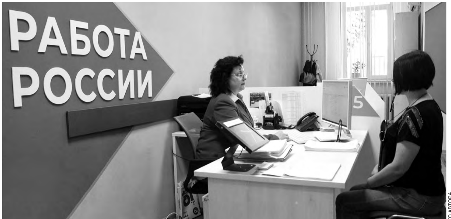
Белгородский центр занятости населения. Приём посетителей.

Электронный формат взаимодействия позволяет гражданину с помощью личного кабинета на портале планировать собеседования, а также фиксировать результаты взаимодействия с работодателями.