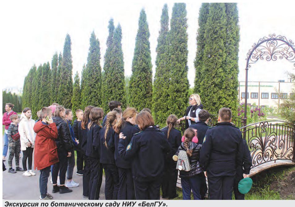
Экскурсия по ботаническому саду НИУ «БелГУ».

► Сотрудники некоммерческой организации совместно с городскими образовательными учреждениями помогают школьникам получить экологические знания и участвовать в конкурсах с темой окружающей среды.