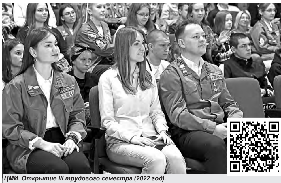
ЦМИ. Открытие III трудового семестра (2022 год).