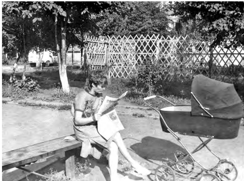
Фото №1. Первая фотография сделана в 1990 году в одном из дворов самого большого дома (на тот момент) на Харьковской горе в Белгороде.

Вид этого дома с самолета напоминает крейсер «Аврора». Во дворе одного из корпусов дома располагалась мастерская известного фотографа В.А. Собровина. В перерывах между работой он выходил на скамейку, запечатлел на фотографии, и делился с героиней сюжета историями о своей интересной работе.