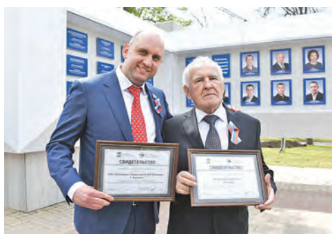
Обновили Аллею Трудовой Славы

Такое оформление города - дань памяти тем, кто погиб на полях сражений, тем, кто с честью вернулся с фронта домой, тем, кто совершал трудовой подвиг в тылу.