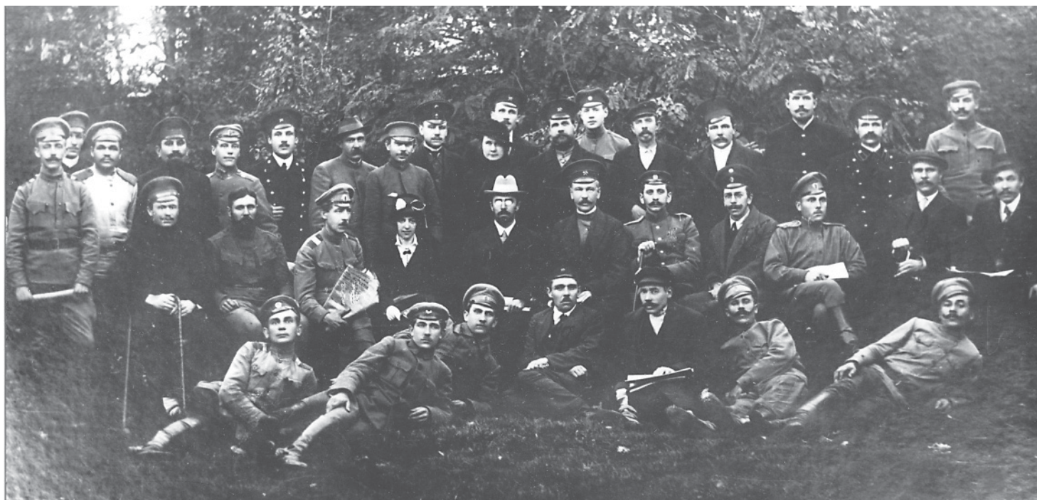
Белгородский Совет рабочих и крестьянских депутатов. Октябрь 1917 года.