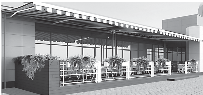
СЕЗОННОЕ КАФЕ Маркиз, веранда, мебель, кашпо и вазоны с цветами

22. Типовое решение внешнего вида нестационарного торгового объекта – сезонного кафе, размещаемого на территории городского округа «Город Белгород»