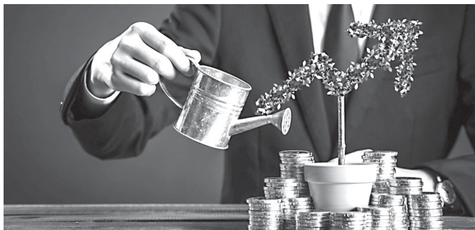
ФОТО ИЗ СВОБОДНЫХ ИСТОЧНИКОВ

Основным источником средств для МСП при осуществлении инвестиций является денежные средства предприятий и личные средства собственников. Средний бизнес, помимо перечисленных видов, чаще использует банковские кре-