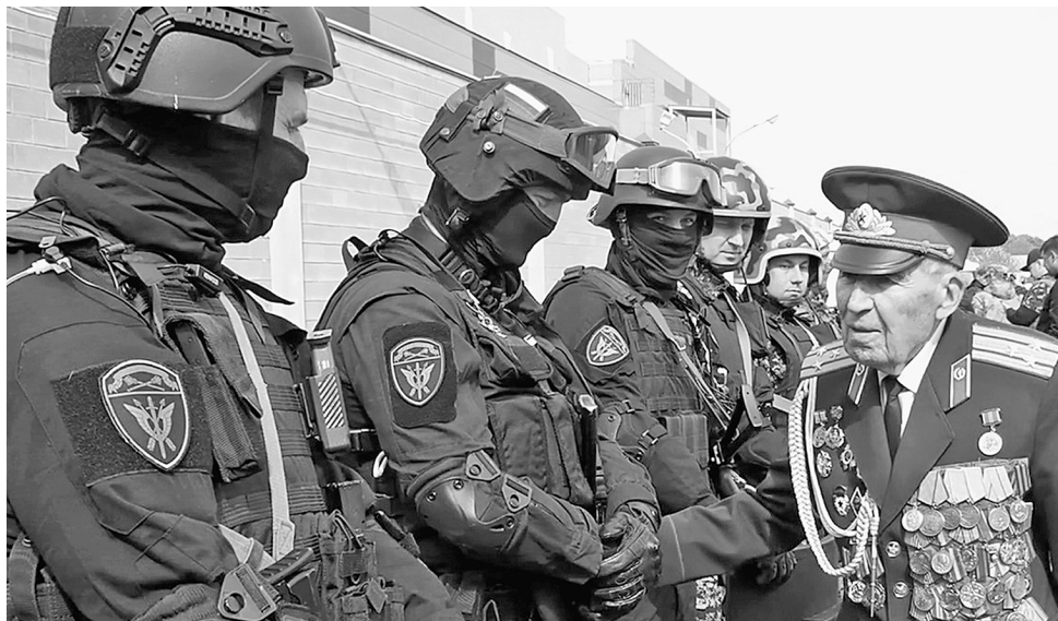
Кадр из клипа.