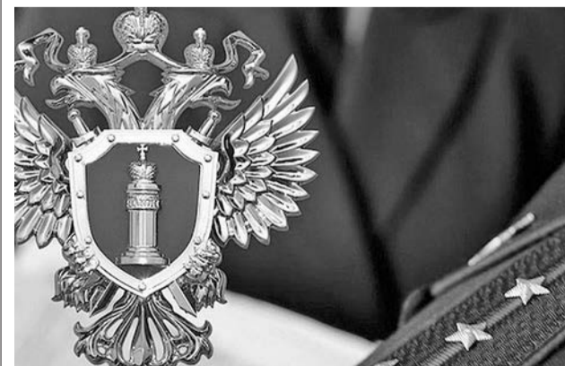
ФОТО ИЗ СВОБОДНЫХ ИСТОЧНИКОВ