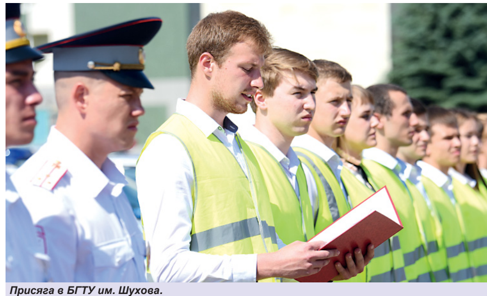
Присяга в БГТУ им. Шухова.