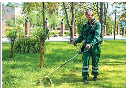
Профессия, создающая красоту