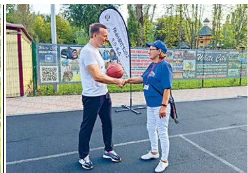
Спортивные каникулы - в рамках партпроекта