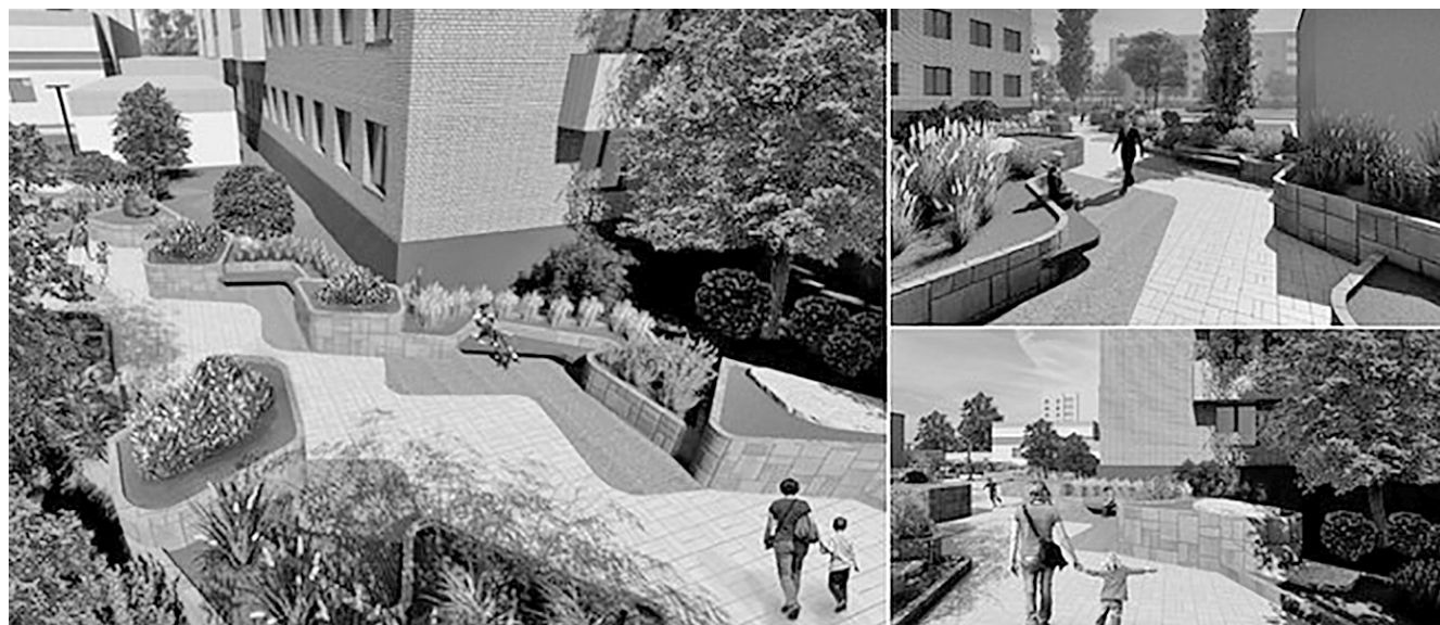
Дизайн-проект благоустройства сквера на ул. Садовой, 116

Материалы полосы подготовила Елена ИВАНОВА