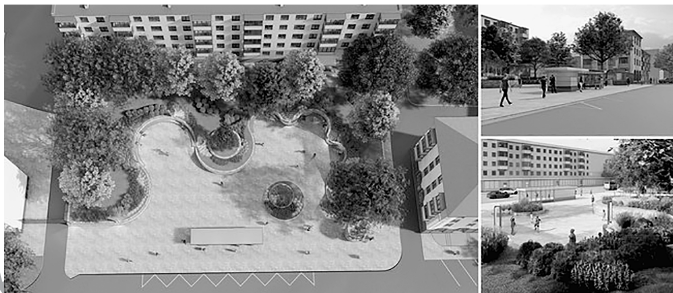
Дизайн-проект благоустройства сквера на ул. Преображенской, 46 (укусное дерево)