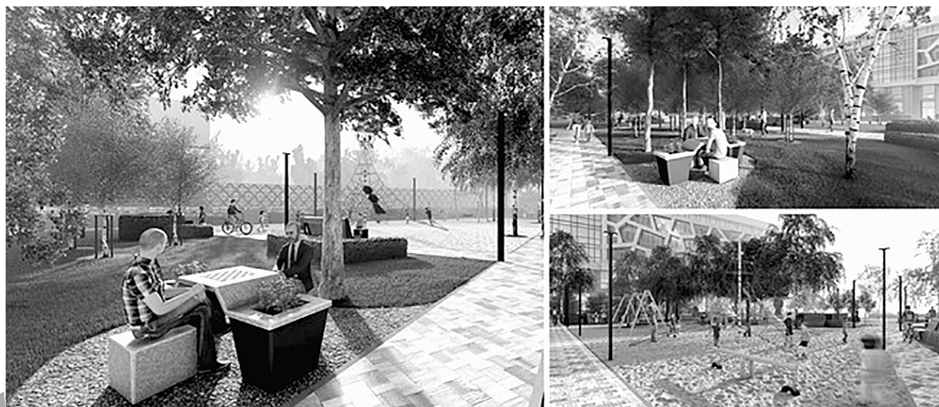
Дизайн-проект благоустройства сквера на пр. Гражданском, 32 (поклонный крест в честь Кирилла и Мефодия)