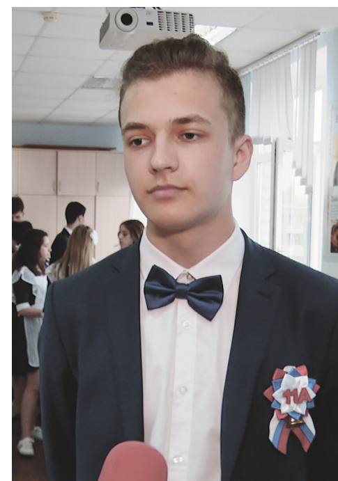
Материалы полосы подготовила Надежда САУШИНА