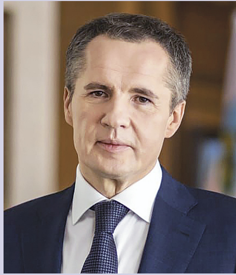
В. ГЛАДКОВ, временно исполняющий обязанности Губернатора Белгородской области

От всей души желаю вам успешной реализации всех намеченных планов, крепкого здоровья, счастья и добрых перемен на благо белгородцев! И помните, вместе нам по силам решить задачи любой сложности!