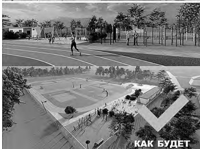
Проект реконструкции стадиона в микрорайоне «Оскочное»

Поступившие материалы были опубликованы на сайте органов местного самоуправления Белгорода для открытого обсуждения с белгородцами.