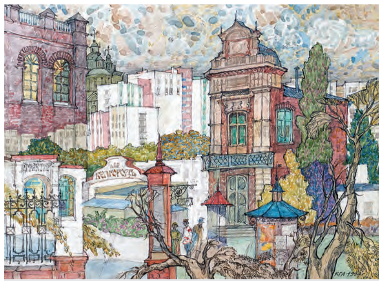
Акварель Г. Кудрявцева «Старый - Новый Белгород», 1994.

Увидены глазами прохожего и улицы центра города, еще частично сохранившие свое провинциальное обаяние, в акварелях «Этюд с телефонной будкой» (1986) и «Назойливый дождичек» (1989) Юрия Данченко и «Марфо-Мариинский женский монастырь» (1991) Петра