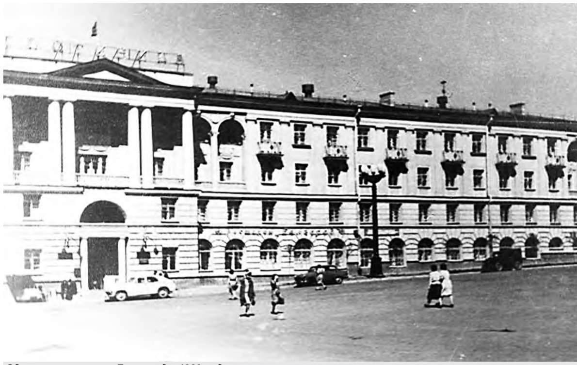
Здание гостиницы «Белгород», 1960 год.

К началу 1956 года строительство гостиницы было завершено. 17 января 1956 года Белгородским горсоветом было выпущено решение № 60 «Об открытии гостиницы «Белгород». В документе значилось следующее: «В соответствии с постанов-