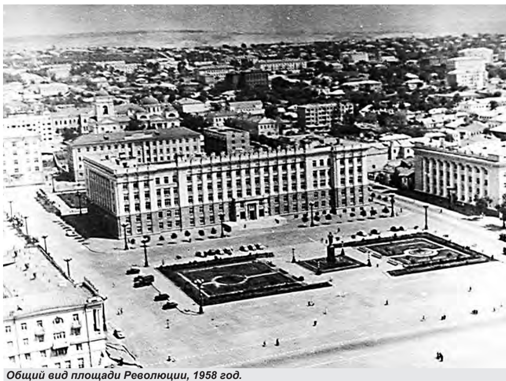
Общий вид площади Революции, 1958 год.