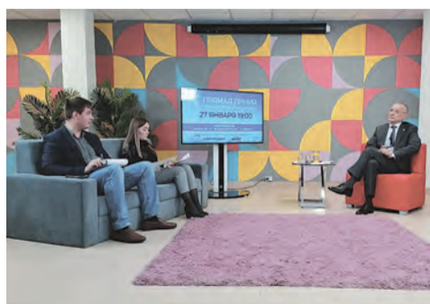
Мэр ответил на вопросы белгородцев

„ Дорогие друзья! Спасибо всем, кто высказался и проголосовал по поводу общественного пространства в Белгороде! Явными фаворитами стали парк Ленина и Архиерейская роща. В итоге в сторис 63% подписчиков проголосовали за парк, а 37% - за рощу. Итак, в первую очередь будем заниматься преобразованием парка имени Ленина. Подготовим проект реконструкции и обязательно вынесем его на обсуждение с жителями города. Про рощу тоже не забудем. Так как вижу большой запрос от жителей Харгоры. Она - следующая в очереди на реконструкцию. Но уже сейчас мы начнём проводить работу по санитарной очистке... “