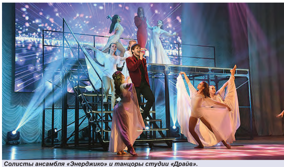
Солисты ансамбля «Энерджико» и танцоры студии «Драйв».