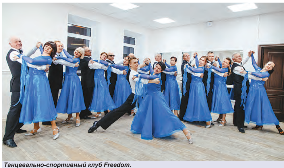
Танцевально-спортивный клуб Freedom.