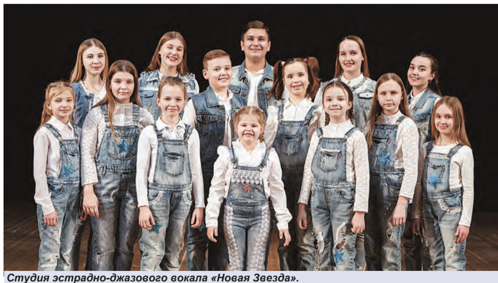
Студия эстрадно-джазового вокала «Новая Звезда».