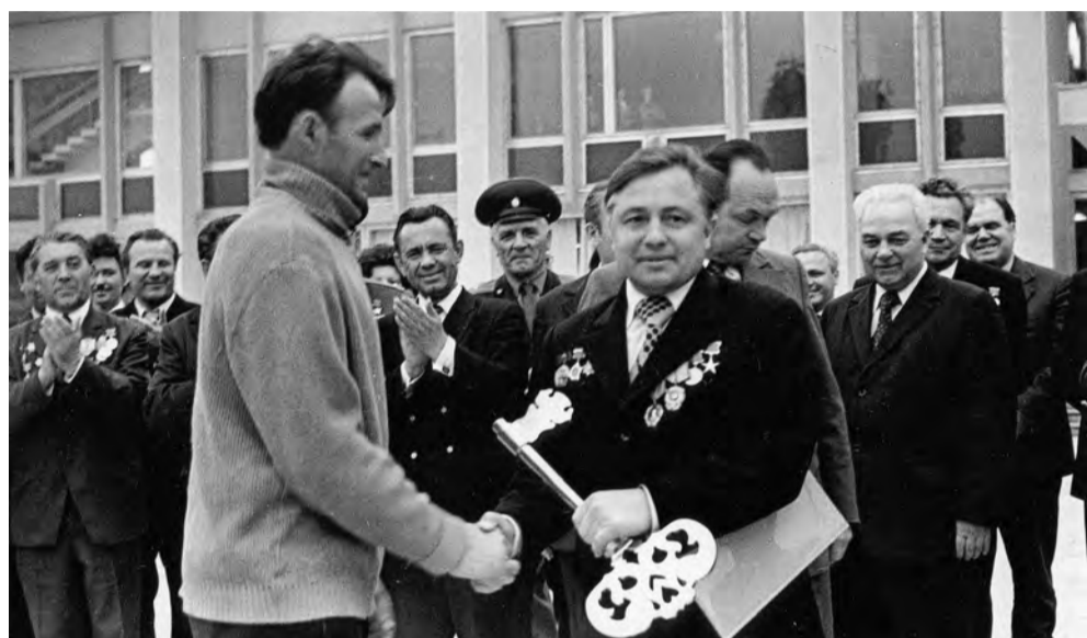
Открытие ДК «Энергомаш». Май 1975 года.