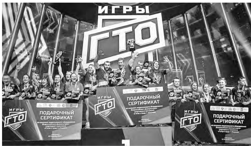
Награждение в Кисловодске.

Всего в Играх ГТО приняли участие 215 сильнейших спортсменов и спортсменок из 32 регионов России.